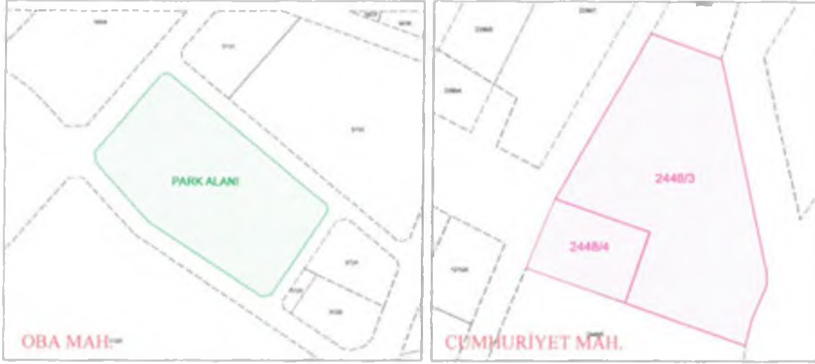
Şekil 3. Kadastral Durum (Oba Mah. - Cumhuriyet Mah.)