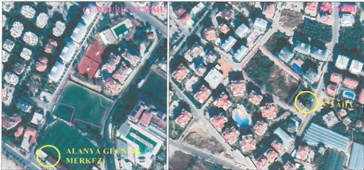
Şekil 2. Yakın Uydu Fotoğrafı