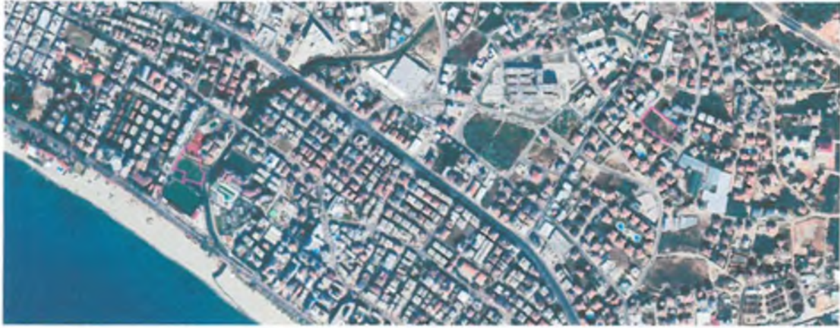
Şekil 1. Uzak Uydu Fotoğrafı

Plan tadilat teklifine konu bölge Antalya ili, Alanya ilçesi, Cumhuriyet Mahallesi, O28D21B numaralı, Oba Mahallesi 19N numaralı 1/5000 Ölçekli, Cumhuriyet Mahallesi, O28D21B1C, O28D21B1D numaralı, Oba Mahallesi 19N1A numaralı 1/1000 Ölçekli paftalarda yer alan, yaklaşık 11944 m 2 büyüklüğündeki alanı kapsamaktadır. Plan değişikliğine konu alan Cumhuriyet Mahallesi sınırları içerisinde yer alan Alanya Gençlik Merkezi'nin kuzeyindeki alan ile Oba Nazmi Yılmaz Anadolu Lisesi'nin yaklaşık 200 metre kuzeyindeki alanı kapsamaktadır.