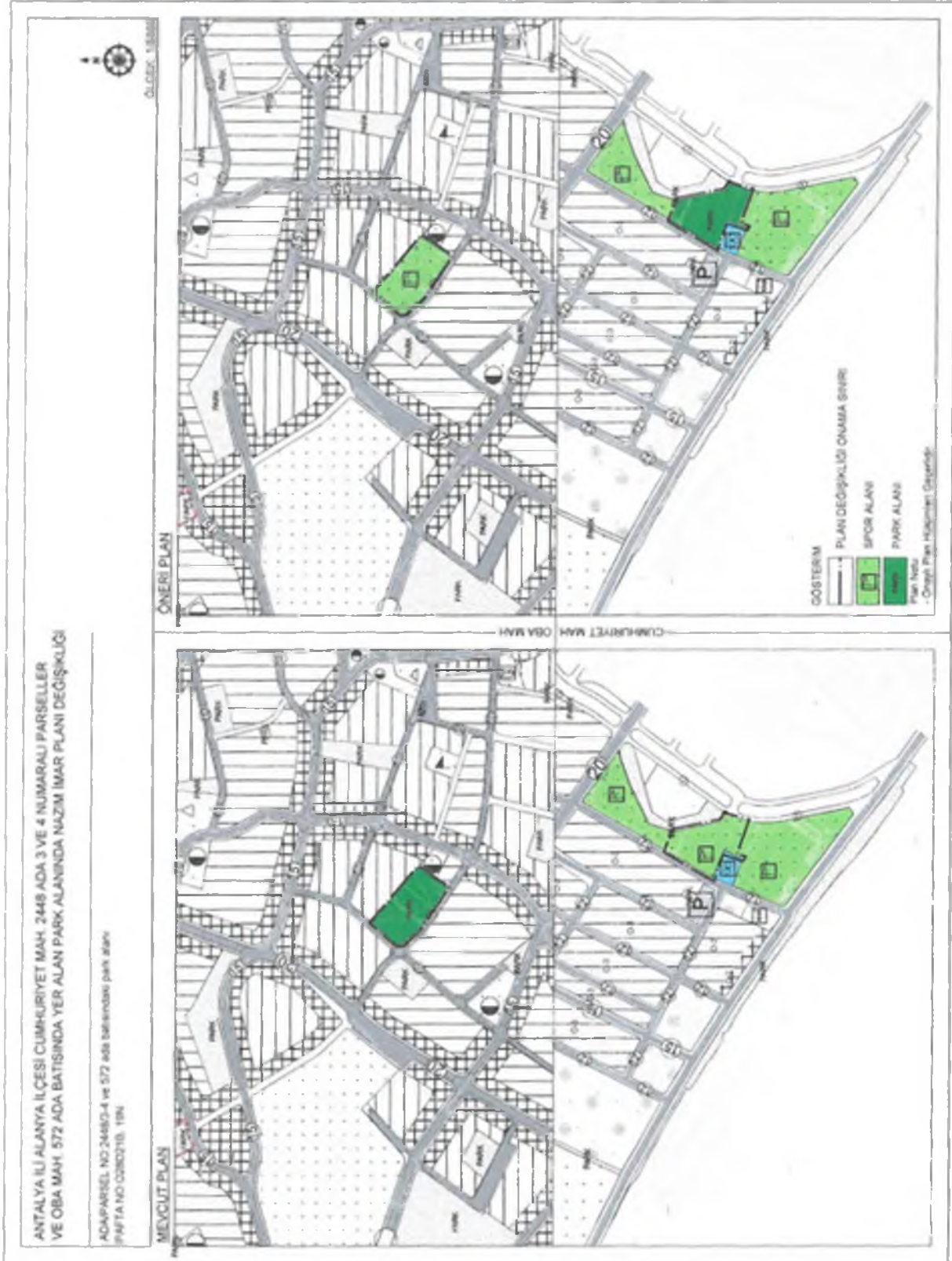
Şekil 4. Onaylı 1/5000 Ölçekli Nazım İmar Planı ve Teklif 1/5000 Ölçekli Nazım İmar Planı