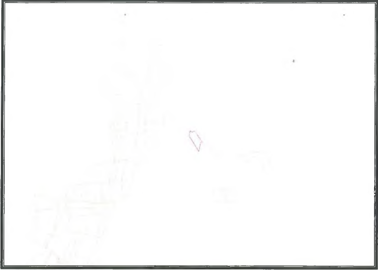
Şekil 2. Kadastral Durum.

Doğançam Mahallesi, 119 ada 9 parsele(17893,11m 2 ) ilişkin kadastral durum aşağıdaki haritada verilmiştir. (Şekil 2)