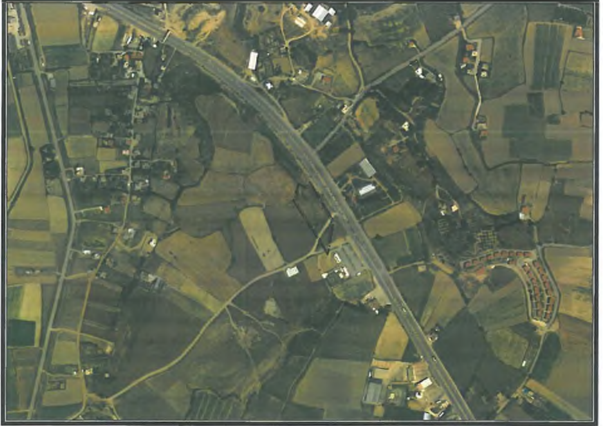
Şekil 1. Hava Fotoğrafi

Planlama Alanı Antalya İli, Manavgat İlçesi, Doğançam Mahallesi, 119 ada 9 parsel(17893,11m 2 ), O27A-21D nolu 1/5000 ölçekli Nazım İmar Planı paftası içerisinde yer almaktadır. (Şekil1).