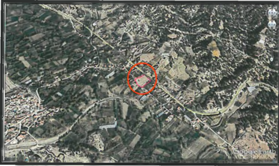
1.Genel Uydu Görüntüsü

Antalya İli, Korkuteli İlçesi, Dereköy Mahallesi sınırlarında yer alan N24D-18A nolu 1/5000 ölçekli Nazım İmar Planı paftasında kalan 995 nolu parselde 1/5000 ölçekli Nazım İmar Planı yapılmaktadır.