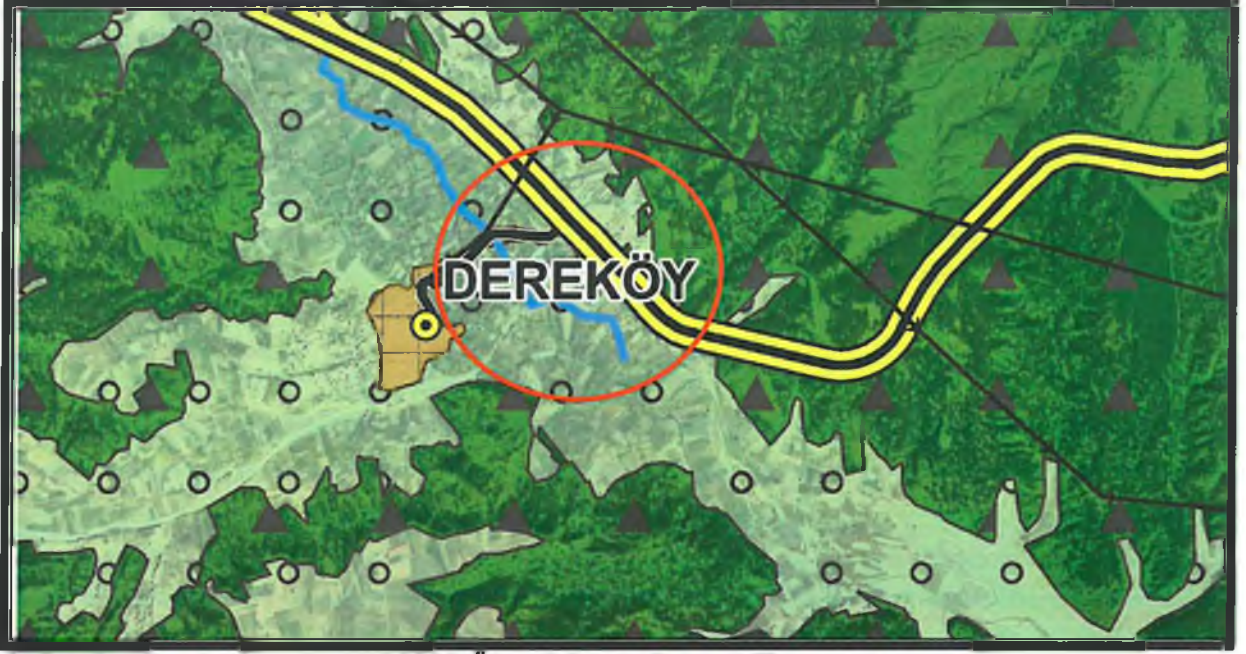
4. Antalya-Burdur-Isparta 1/100000 Ölçekli Çevre Düzeni Planı