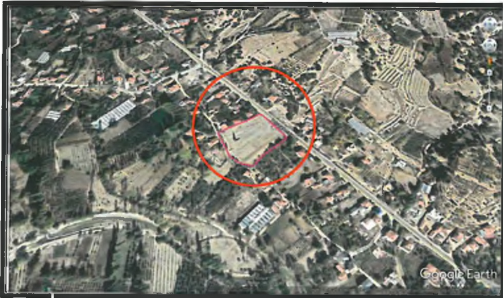
2. Planlama Alanı Uydu Görüntüsü