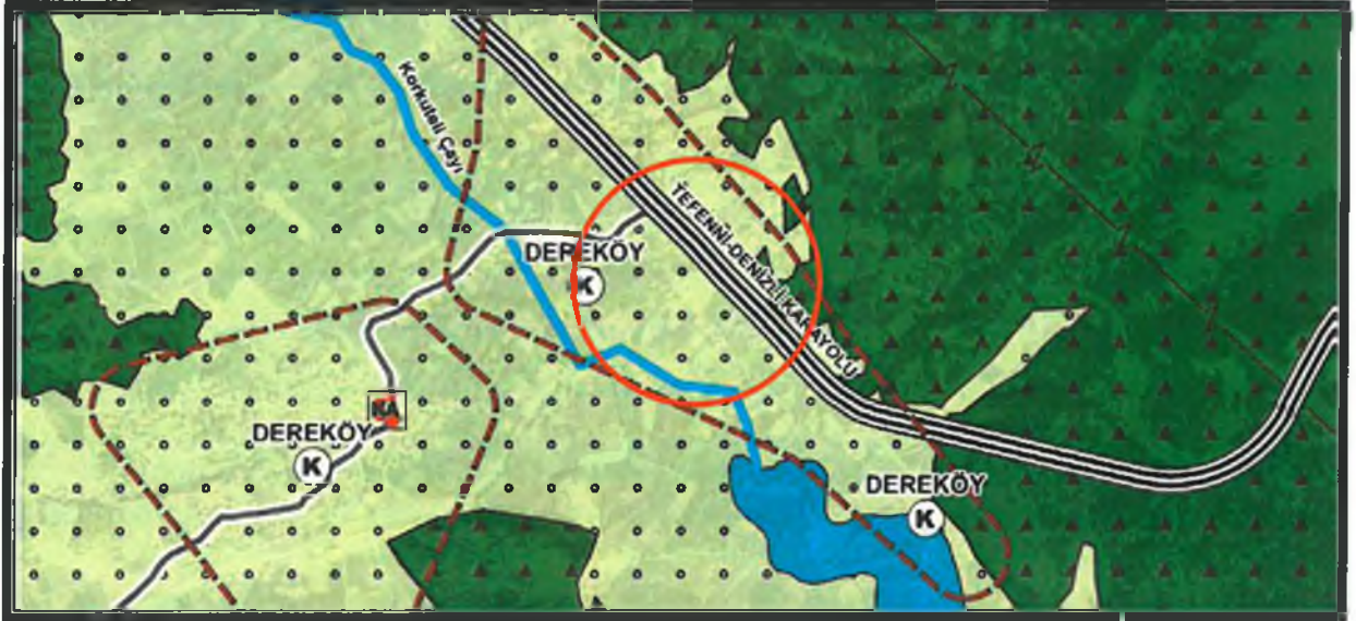
5. Korkuteli İlçesi 1/25000 Ölçekli Nazım İmar Planı