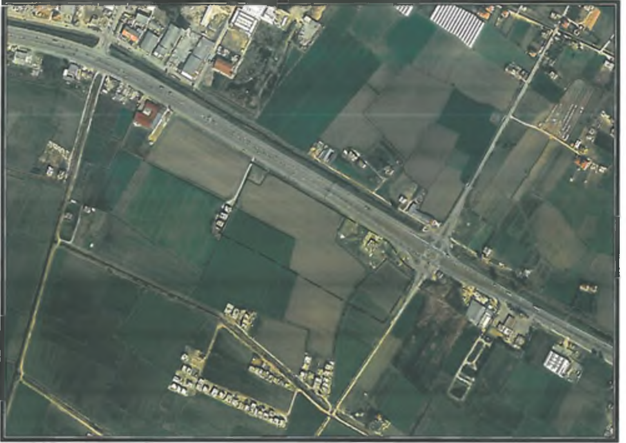
Şekil 1. Hava Fotoğrafı

Planlama Alanı Antalya İli, Manavgat İlçesi, Aşağıışıklar Mahallesi, 181 ada 1 parsel ile 182 ada 1, 2, 3 parseller ve çevresi(82884,48m 2 ), O26-B3 nolu 1/5000 ölçekli Nazım İmar Planı paftası içerisinde yer almaktadır. (Şekil1).