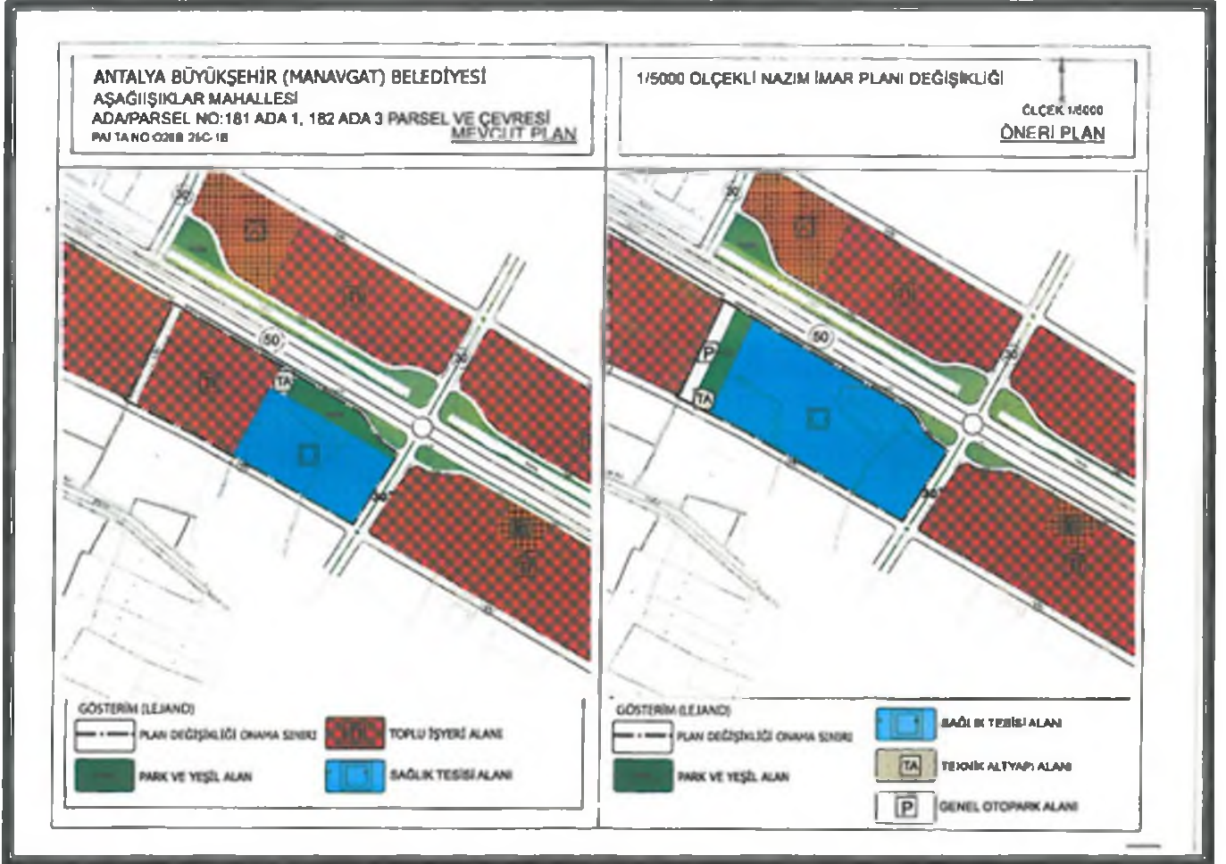
Şekil 3. Mevcut 1/5000 ölçekli nazım imar planı-Öneri 1/5000 ölçekli Nazım İmar Planı değişikliği.