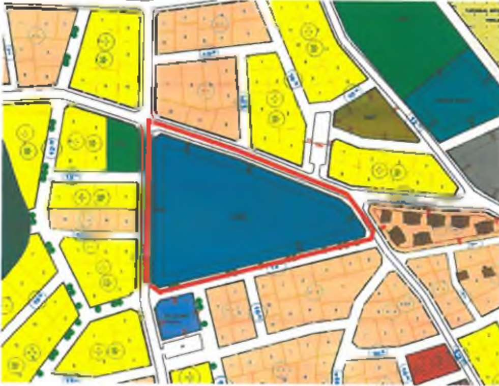
Şekil 4: Mevcut 1/1000 ölçekli Uygulama İmar Planı