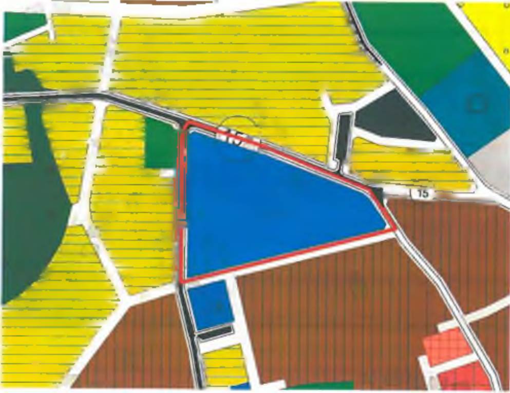
Şekil 3: Mevcut 1/5000 ölçekli Nazım İmar Planı