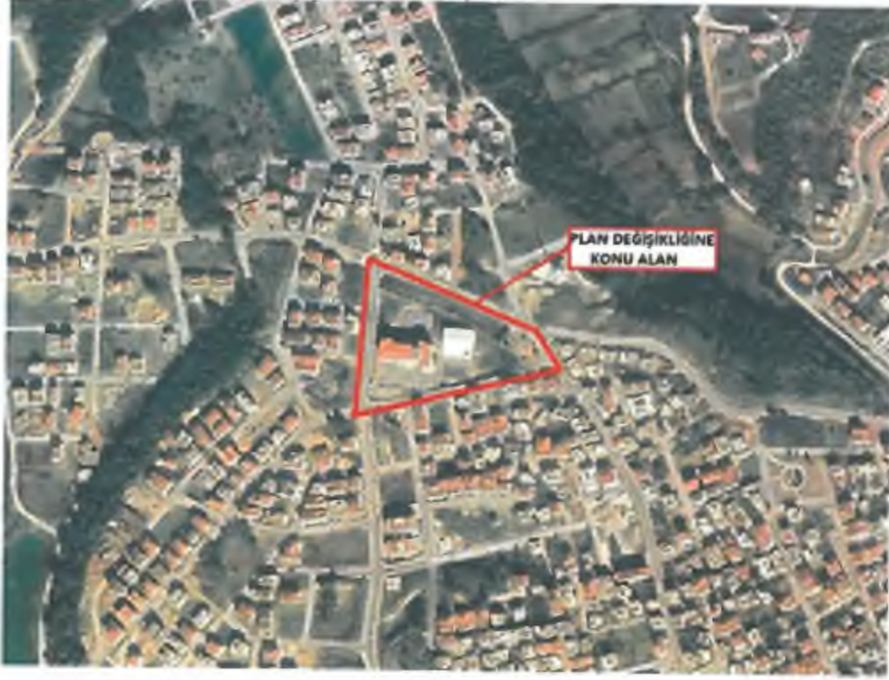
Şekil:2 Uydu görünüşü

Plan değişikliğine konu alan Sarılar Mahallesi Çağlayan Caddesi üzerinde yer almaktadır. D400 Karayoluna yaklaşık 2.5 km, Manavgat Irmağına yaklaşık 5 km mesafededir.