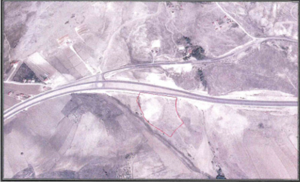
Şekil 1. Hava Fotoğrafı

1/1000 ölçekli Uygulama İmar Planı önerisi hazırlanan 1956 parsel Antalya İli, Korkuteli İlçesi, Kızılcaadağ mahallesi sınırları içerisinde kalmaktadır. Karayolları Genel Müdürlüğü 13. Bölge Müdürlüğü'nün yol ağına dahil Antalta-Korkuteli- 2. Bl. Hd. Yolu üzerinde olup onaylı projesinde Km:81+771.172 üzerinde yer alan K-16 kavşak alanında kalmaktadır. Söz konusu alan tarım arazisi olup boş olduğu görülmektedir. Faaliyet alanı içerisinde içme ve kullanma su kaynağı ile termal ve mineral su kaynağına rastlanmamıştır. Taşınmaz N23C 25B imar plan paftasında yer almaktadır.