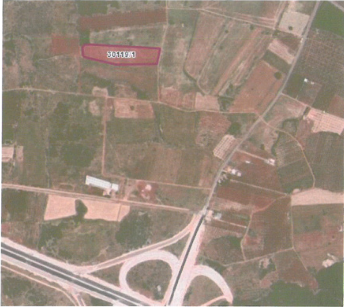
Şekil 1: Planlama Alanın Uydur Görüntüsü

Planlama alanının batısında Organize Sanayi Bölgesi, güneyinde ise Kepez Belediyesi, Kirişçiler Mahallesi sınırları içinde bulunan seyrek yerleşim alanları ile tarım alanları bulunmaktadır.