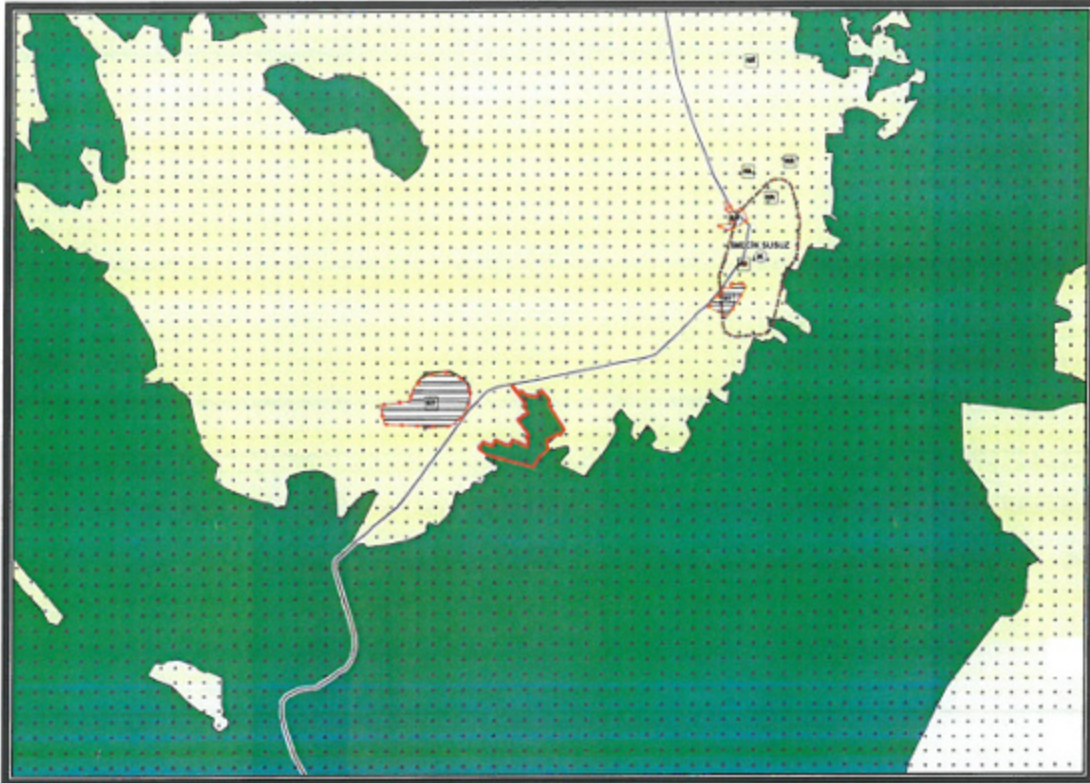
Şekil 4. Mevcut 1/25.000 ölçekli Nazım İmar Planı