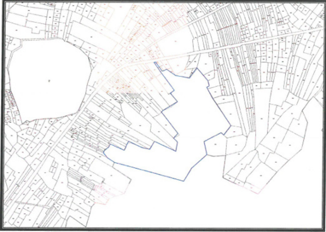
Şekil 2. Kadastral Durum.

İmecik Mahallesi, Korkuteli Orman İşletme Müdürlüğü Yazır Şefliği 592 nolu bölmenin bir kısmı ile 9911 ve 9629 parsellere ilişkin kadastral durum aşağıdaki haritada verilmiştir. (Şekil 2)