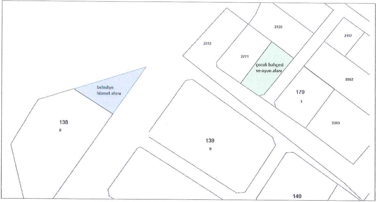
Şekil 3. Kadastral Durum