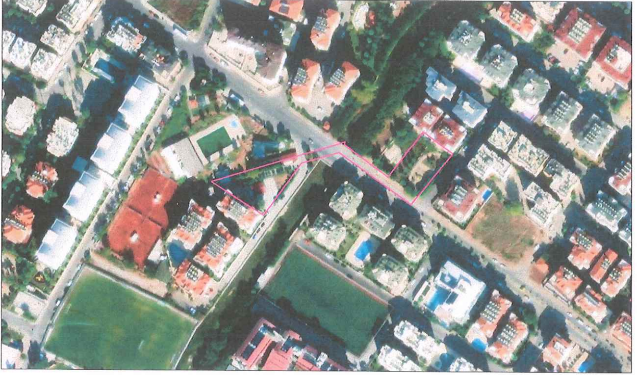
Şekil 1- Hava Fotoğrafi

Uygulama imar planı tadilat teklifine konu alan; Antalya İli, Alanya İlçesi, Oba Mahallesi sınırları içerisinde bulunmaktadır. Keykubat Bulvarı güneyi, Oba Çayı doğusu ve batısı üzerinde konumlanan plan tadilatına konu bölge, 2771 parselin doğusundaki park alanı ve güneybatısındaki belediye hizmet alanını kapsamaktadır. Plan tadilatına konu alan yaklaşık 1706 m 2 'dir.