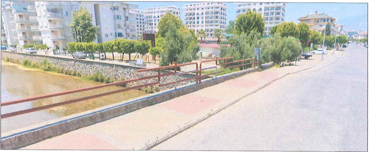
Şekil 4. Belediye Hizmet Alanına İlişkin Alan Görüntüsü