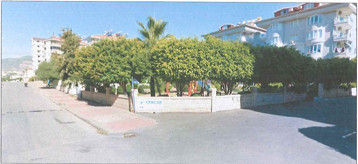
Şekil 5. Park Alanına İlişkin Alan Görüntüsü