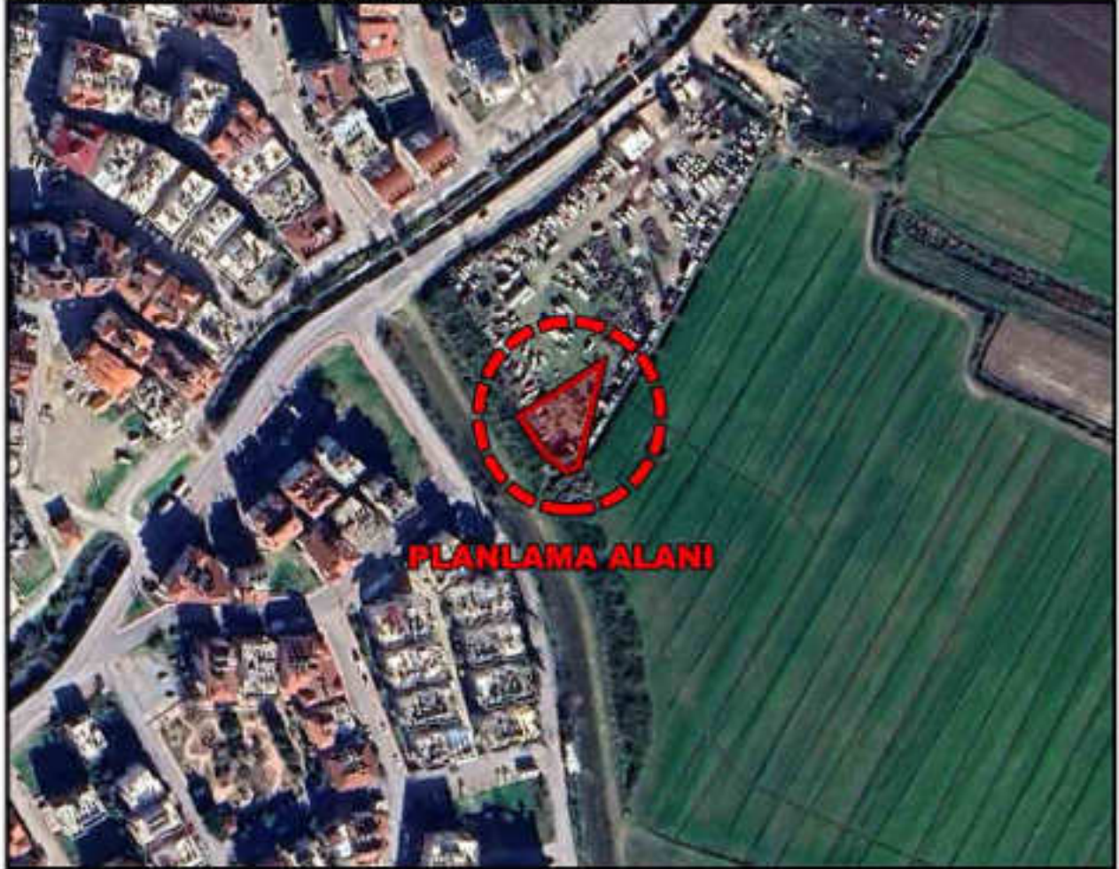
Şekil 1: Plan Değişikliğine Konu Alanın Uydu Görüntüsü

Planlamaya konu alanın yakın çevresinde; konut yerleşme alanı, boş alanlar ile tarlalar yer almaktadır.