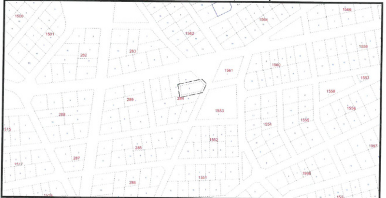
Şekil 2. Kadastral Durum

284 ada 5 parsel Döşemealtı İlçesi Çıplaklı tapulama sahası içerisinde yer almaktadır.