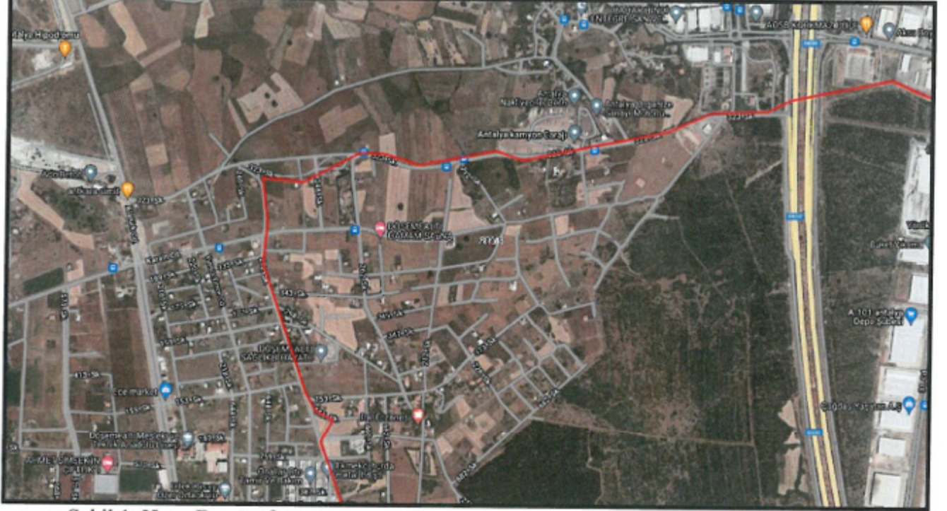
Şekil 1. Hava Fotoğrafı

Antalya İli Döşemealtı ilçesi sınırları içerisinde N25D-18D-1C ve N25D-18D-1D nolu 1/1000 ölçekli uygulama imar planı paftalarında yer almaktadır