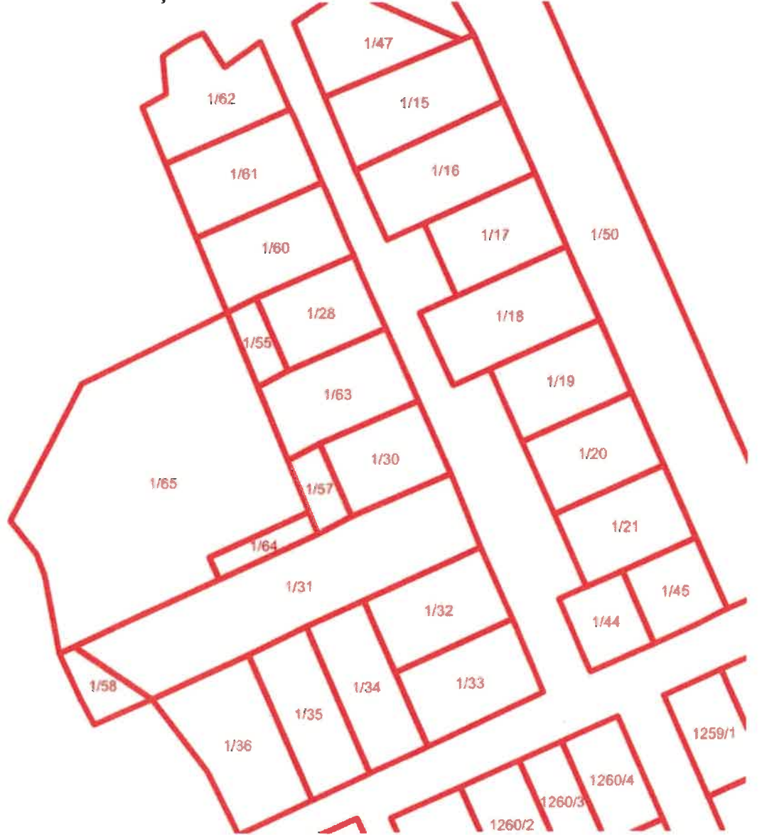
Şekil 2. Kadastral durum.

Söz konusu parselle ilişkin kadastral durum aşağıdaki haritada verilmiştir. (Şekil 2 )