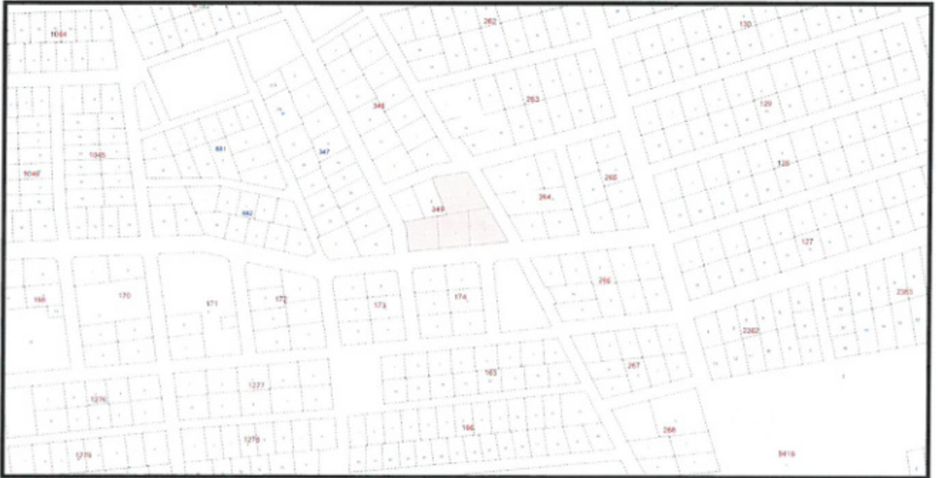
Şekil 2. Kadastral Durum

349 ada 3-4-5-6-7 nolu parseller, Döşemealtı ilçesi Kırkgöz Yeniköy Mahallesi sınırları içerisinde yer almaktadır.