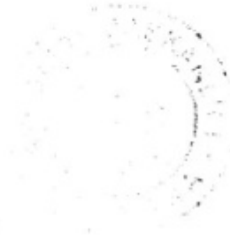
Yusuf AKYOL Memur

BELGENİN ASLI ELEKTRONİK İMZALIDIR 22 Temmuz 2020