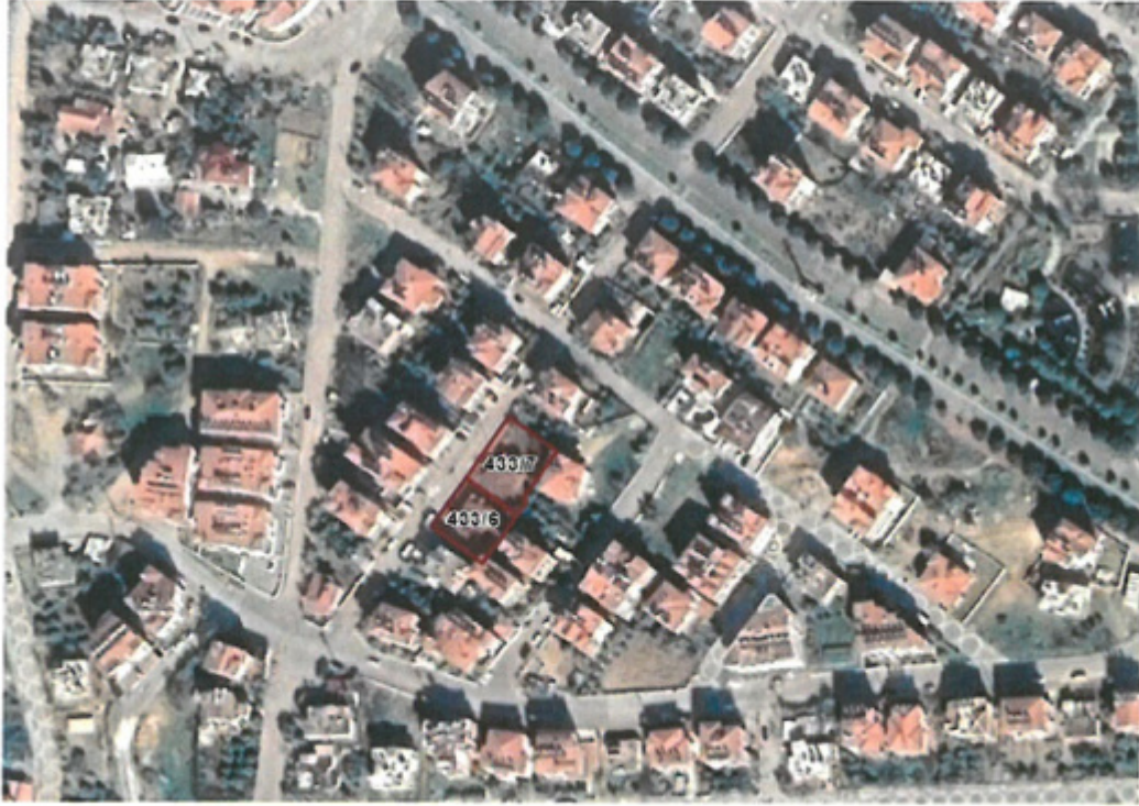
Şekil:2 Uydu görüntüsü

Yakın çevresinde cezaevi, Yeni Camii, Adile Naşit parkı, pazaryeri, konut alanları ile boş arsalar bulunmaktadır.