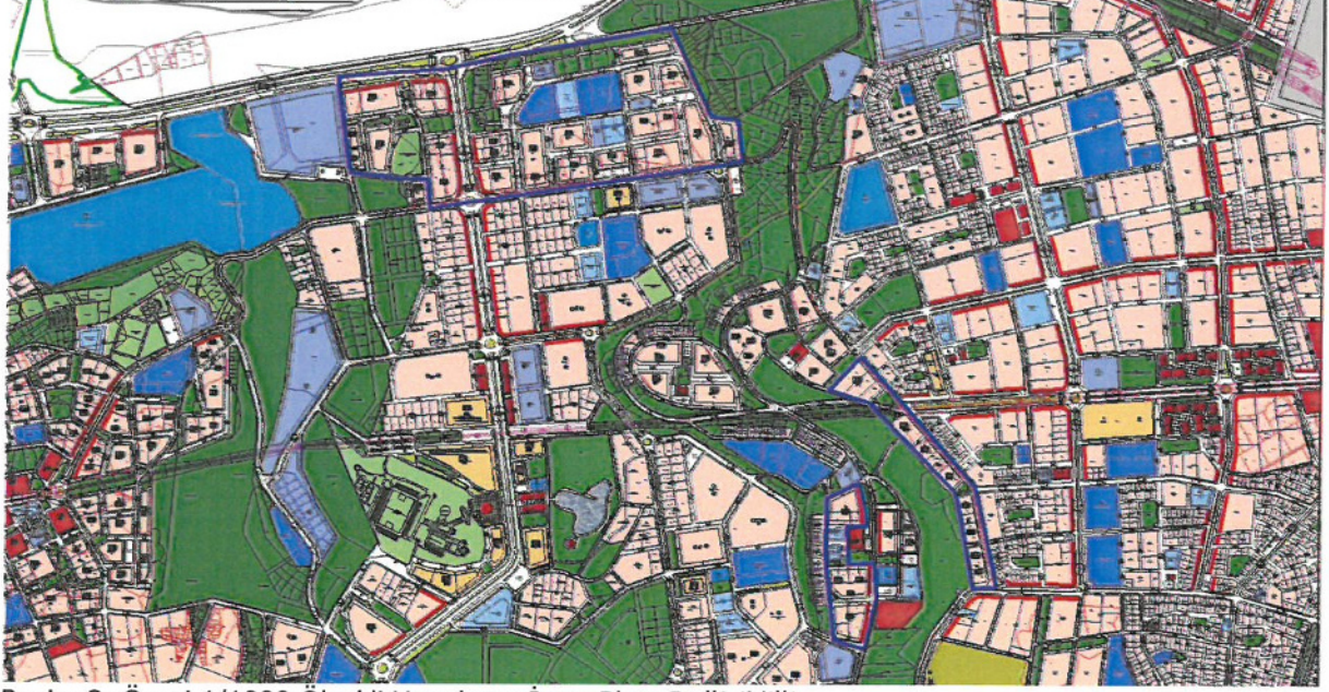
Resim 3: Öneri 1/1000 Ölçekli Uygulama İmar Planı Değişikliği

kullanılmamaktadır. Bu sorunu çözmek amacıyla plan onama sınırı içerisinde kalan konut alanlarında aşağıdaki plan notları geliştirilmiştir (Bkz: Resim 3 ve Plan Notları).