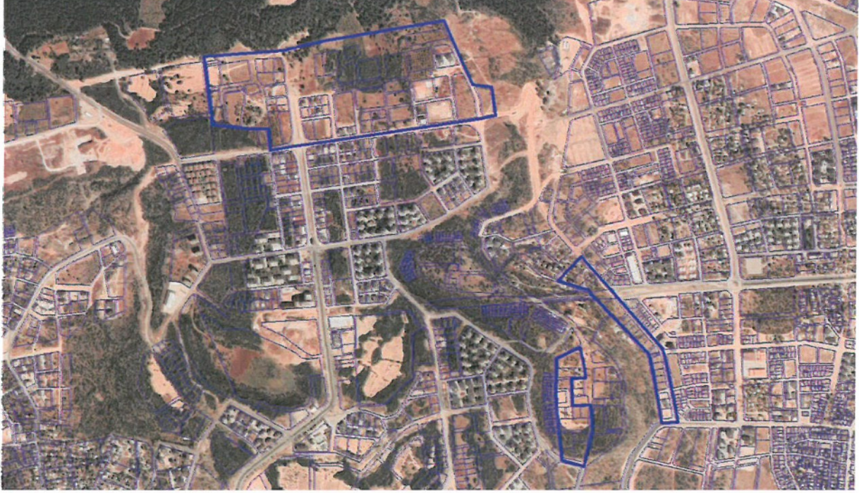
Resim 1: Uydu Görüntüsü

Plan değişikliği; Antalya İli, Kepez İlçesi, Çankaya ve Fevzi Çakmak Mahalleleri, O25-A-04-C-4-A/4-B/4-C/4-D, O25-A-04-D-3-B/3-C ve O25-A-09-B-2-A/2-B/2-C/2-D nolu 1/1000 ölçekli uygulama imar planı paftalarında yer alan ve yapı yaklaşma mesafesi 10 metre olan bazı konut alanlarını kapsamaktadır (Bkz: Resim 1 ve 2).