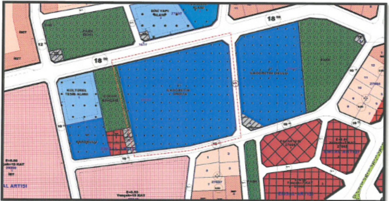
Resim 2: mevcut 1/1000 Ölçekli Uygulama İmar Planı

Handwritten signature or initials in blue ink.