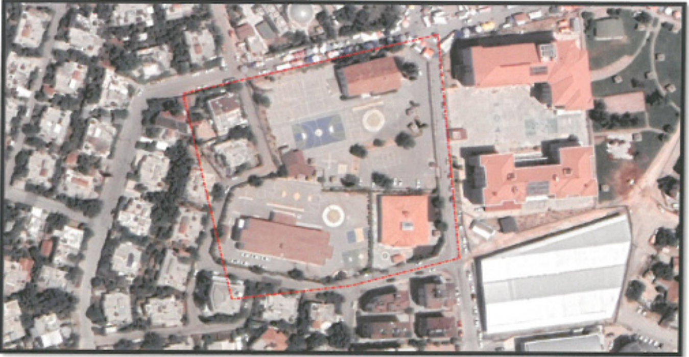
Resim 1: Uydu Fotoğrafı

Plan değişikliğine konu alan, Antalya İli, Kepez İlçesi, Yeniemek Mahallesi, 29342 ada 2 parselde kalan İlkokul Alanı olarak planlı alandır.