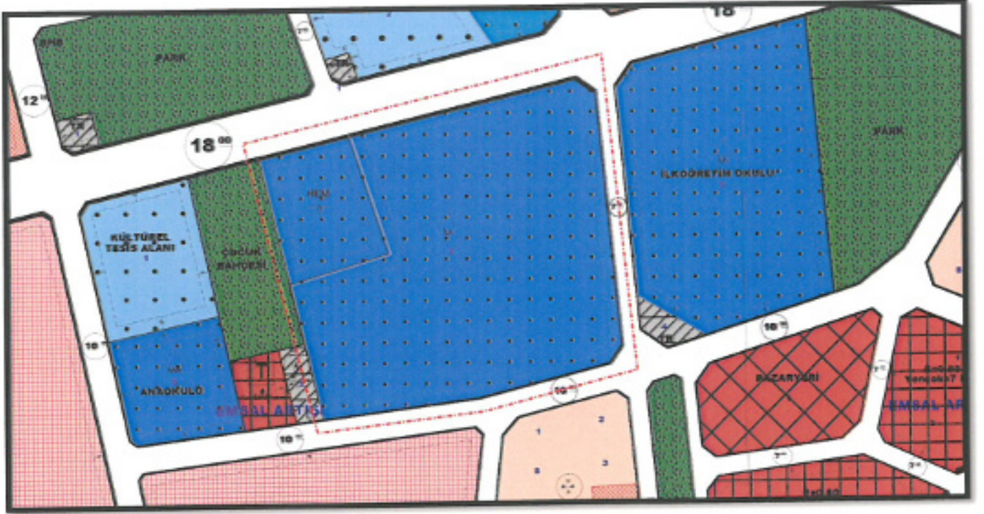
Resim 3: 1/1000 Ölçekli Uygulama İmar Planı Değişikliği Önerisi

Antalya İl Milli Eğitim Müdürlüğü'nün talebi üzerine ilkököl Alanının Kuzey- Batı cephesinde 1,950 m 2 büyüklüğünde Halk Eğitim Merkezi Alanı ayrıldığı 1/1000 ölçekli Uygulama İmar Planı Değişikliği önerisi hazırlanmıştır.