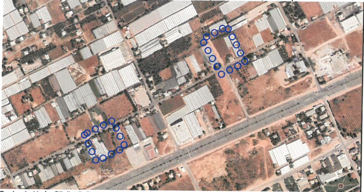
Resim 1: Uydu Görüntüsü

Plan revizyonu; Antalya İli, Kepez İlçesi, Menderes Mahallesi, O25-A-06-A ve O25-A-06-B nolu 1/5000 ölçekli nazım imar planı paftalarında yer alan 28500 adadaki otopark alanı ile 28507 ada batısındaki park alanını kapsamaktadır (Bkz: Resim 1, 2 ve 3).