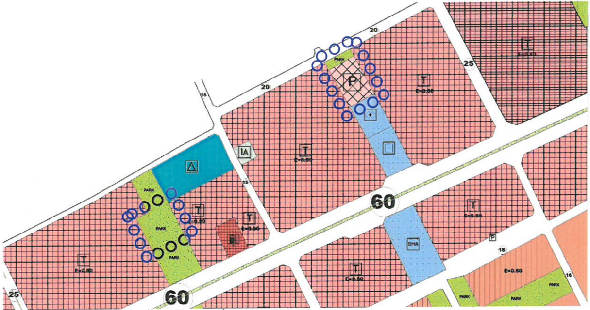
Resim 3: Mevcut 1/5000 Ölçekli Nazım İmar Planı