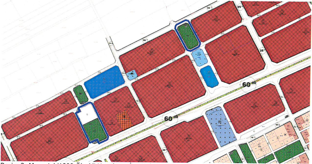
Resim 2: Mevcut 1/1000 Ölçekli Uygulama İmar Planı

Menderes Mahallesi'nin orta ve kuzey kesimlerinde yaşayan vatandaşlarımıza hizmet etmek üzere acil bir Pazar yerine ihtiyaç vardır. Ancak Mahallenin bu kesimleri planlı olmadığı için planlı alanlar içerisinde yer seçimi yapılması gerekmektedir. Bu bölgeye en yakın nokta olan 28507 ada batısındaki park alanının bir kısmının Pazar olarak planlanması uygun görülmüştür. Bu değişikliğin yapılabilmesi için öncelikle 1/5000 ölçekli nazım imar planının revize edilmelidir.