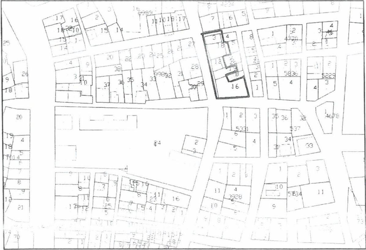
Şekil 2. Kadastral Durum

Söz konusu parseller üzerinde yapılar mevcuttur.