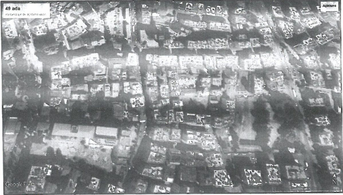
Şekil 1.Hava Fotoğrafı

Plan değişikliğine konu alan; Antalya ili, Muratpaşa İlçesi, Sinan Mahallesi sınırları dahilinde 19K-II b,20K-III C nolu 1/1000 Ölçekli Uygulama İmar Planı paftalarında kalmaktadır.