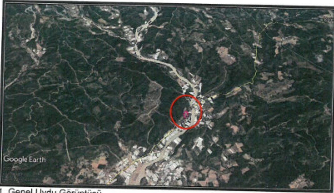
1. Genel Uydu Görüntüsü

Antalya İli, Kaş İlçesi, Karadağ Mahallesi sınırlarında yer alan P23B-13A nolu 1/5000 ölçekli Nazım İmar Planı paftasında kalan 301 ada 9 ve 11 nolu parsellerde 1/5000 ölçekli Nazım İmar Planı yapılmaktadır.