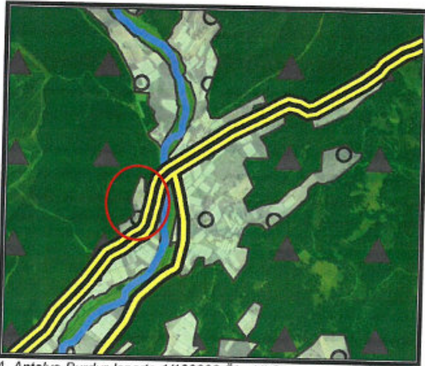
4. Antalya-Burdur-Isparta 1/100000 Ölçekli Çevre Düzeni Planı

301 ada 9 ve 11 nolu parsel Antalya Büyükşehir Belediye Meclisince onaylanan Antalya-Burdur-Isparta Planlama Bölgesi 1/100000 Ölçekli Çevre Düzeni Planı P23 nolu paftasında "Tarım Arazisi"nde kalmaktadır.