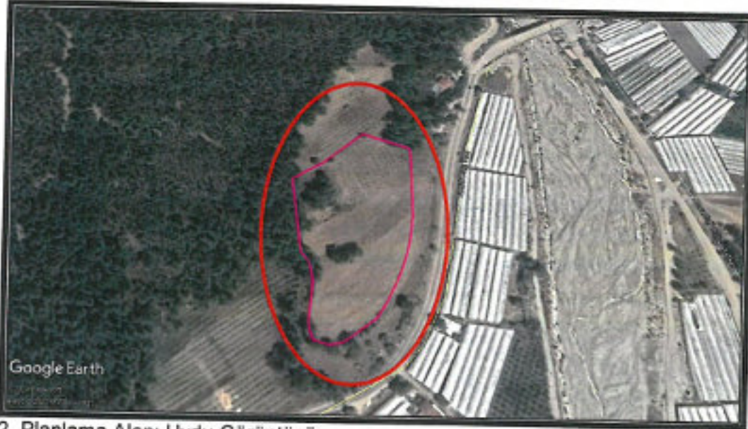
2. Planlama Alanı Uydu Görüntüsü