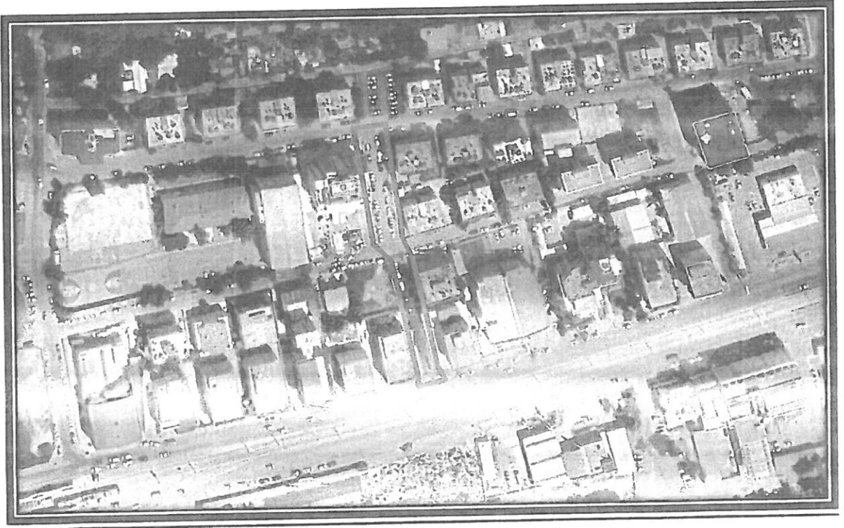
Şekil 1. Hava Fotoğrafi

Plan değişikliğine konu alan Muratpaşa İlçesi'nde, Kızıltoprak Mahallesi 20L-IIId ve 20L-IVc imar paftaları içerisinde bulunan 2528, 2529, 2530 ve 2531 adalar arasındaki imar yollarını kapsamaktadır.