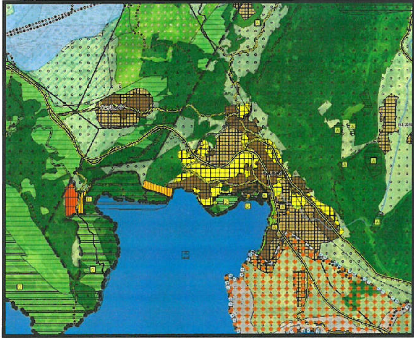
Planlama Alanlarının ve Yakın Çevresinin Antalya-Burdur-Isparta Planlama Bölgesi 1/100.000 ölçekli Çevre Düzeni Planındaki Yeri

Antalya Büyükşehir Belediyesi Meclisince onaylanan Antalya İli Kaş İlçesi 1/100000 ölçekli Çevre Düzeni Planı P23 pafta sınırları içerisinde kalmakta olup; planda bu mahalle kırsal yerleşim alanı, kentsel gelişme alanı, kentsel yerleşik alanı, çevresi orman alanı, tarım alanları olarak gösterilmiştir.