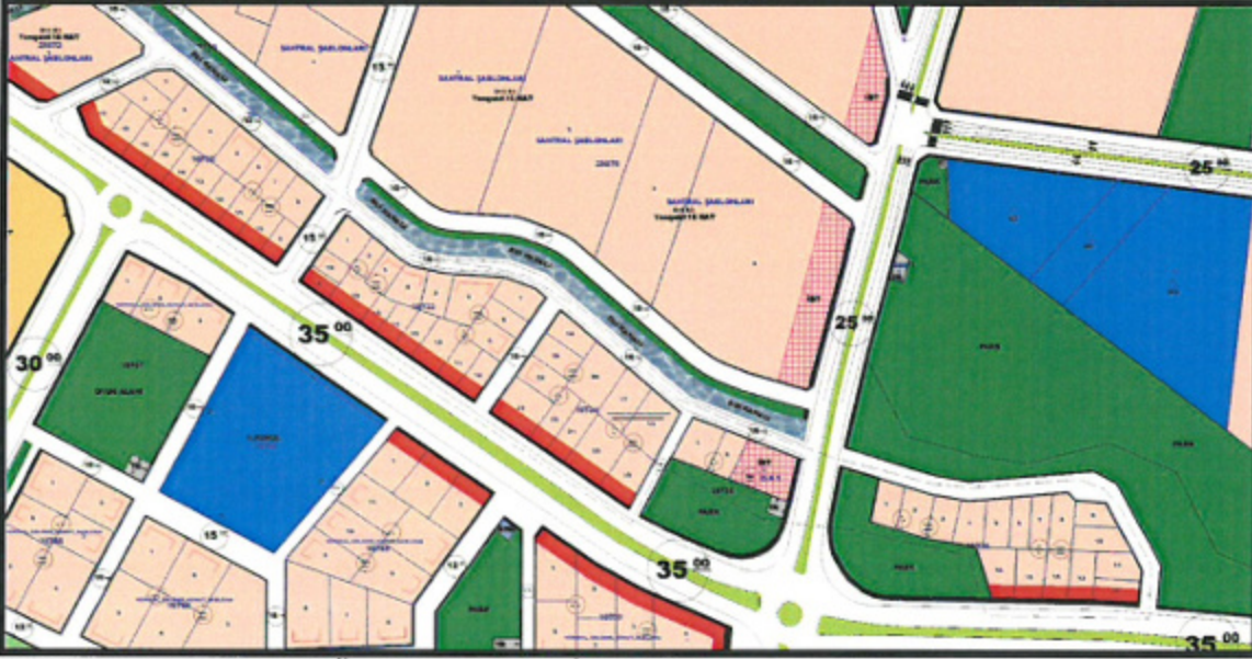
Resim 2: Mevcut 1/1000 Ölçekli Uygulama İmar Planı

Antalya İli, Kepez İlçesi, Ünsal Mahallesi, 10732, 10733, 10734, 10735 ve 10736 adaları kapsayan alan mevcut 1/1000 ölçekli uygulama imar planında, ikiz nizam 2 katlı, T.A.K.S.=0.30 ve K.A.K.S=0.60 yapılaşma hakkına sahip konut alanı olarak planlıdır.