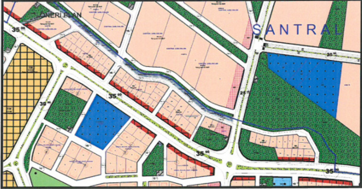
Resim 4: Öneri 1/1000 Ölçekli Uygulama İmar Planı

Hazırlanan plan değişikliği ile, Antalya İli, Kepez İlçesi, Ünsal Mahallesi, 10732, 10733, 10734, 10735 ve 10736 adaları kapsayan konut alanlarında emsal değeri değiştirilmeden kat sınırlaması (KS) uygulaması getirilmiştir.