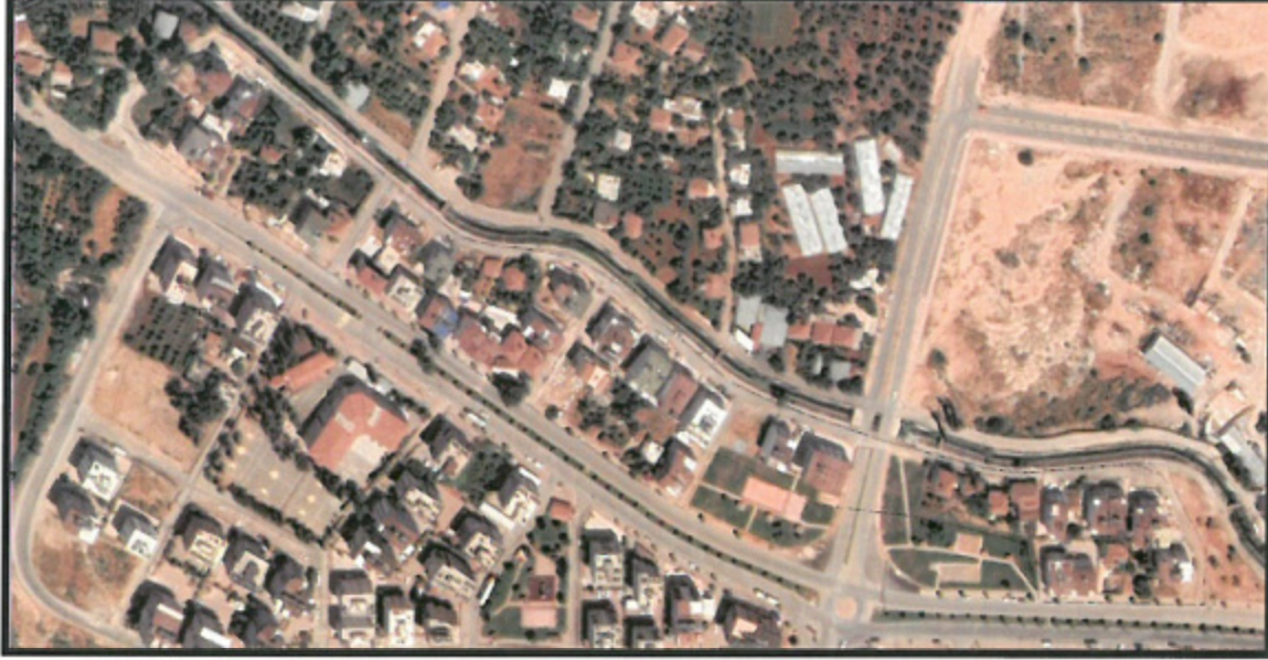
Resim 1: Uydu Görüntüsü

Plan revizyonu; Antalya İli, Kepez İlçesi, Ünsal Mahallesi, O25-A-08-B-4-A ve O25-A-08-B-4-B nolu 1/1000 ölçekli uygulama imar planı paftalarında kalan, 10732, 10733, 10734, 10735 ve 10736 adaları kapsamaktadır (Bkz: Resim 1 ve 2).