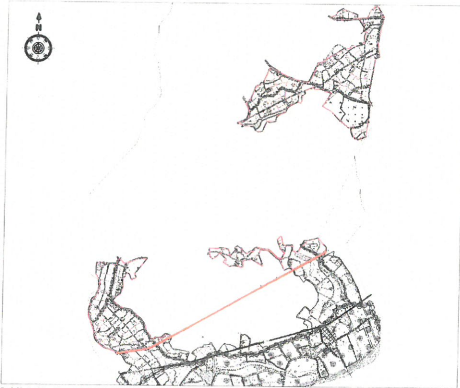
Şekil 4: Türkler Mahallesi ilave Plan Hükümlerinin Kapsadığı Alanın Plan Üzerinde Gösterimi

Takdir Büyükşehir Belediye Meclisindedir. 28.12.2021