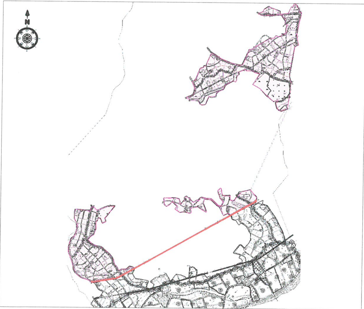
Şekil 4: Türkler Mahallesi ilave Plan Hükümlerinin Kapsadığı Alanın Plan Üzerinde Gösterimi