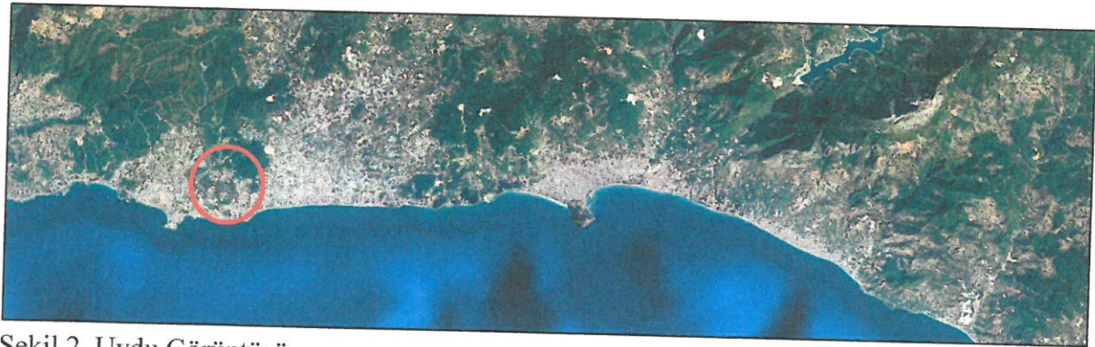
Şekil 2. Uydu Görüntüsü