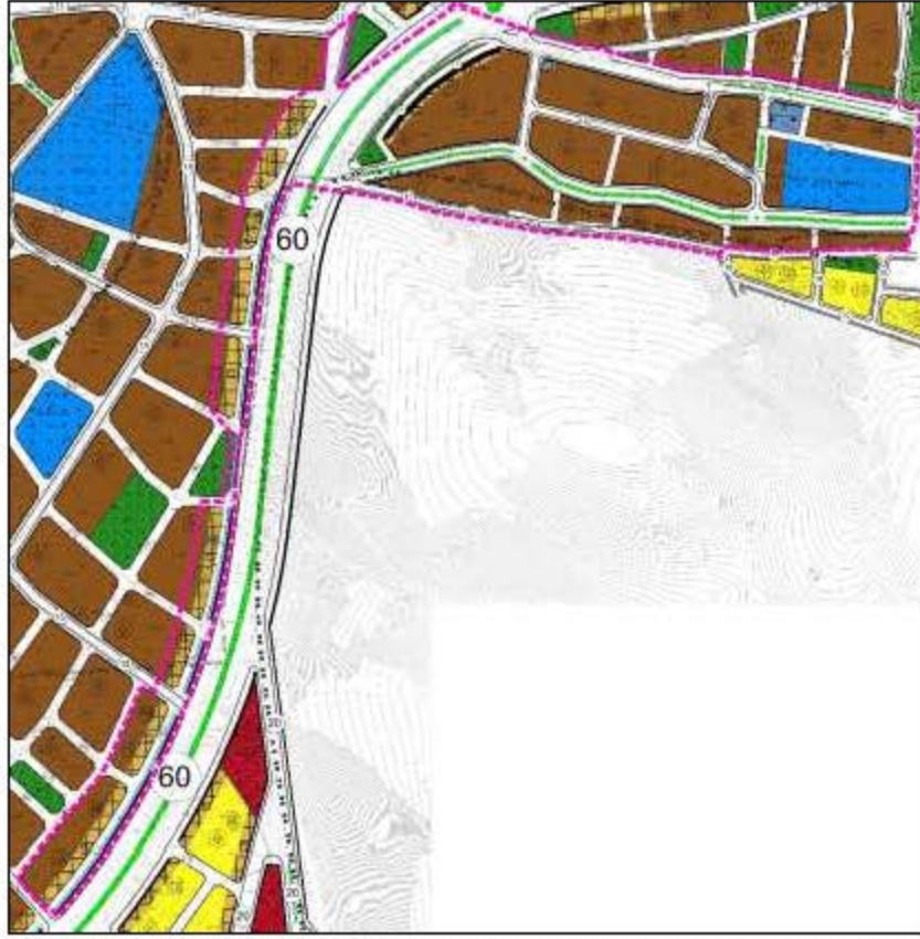
Şekil 5. Planlama konusu alanın 1/1000 Ölçekli Uygulama İmar Planı'ndaki yeri