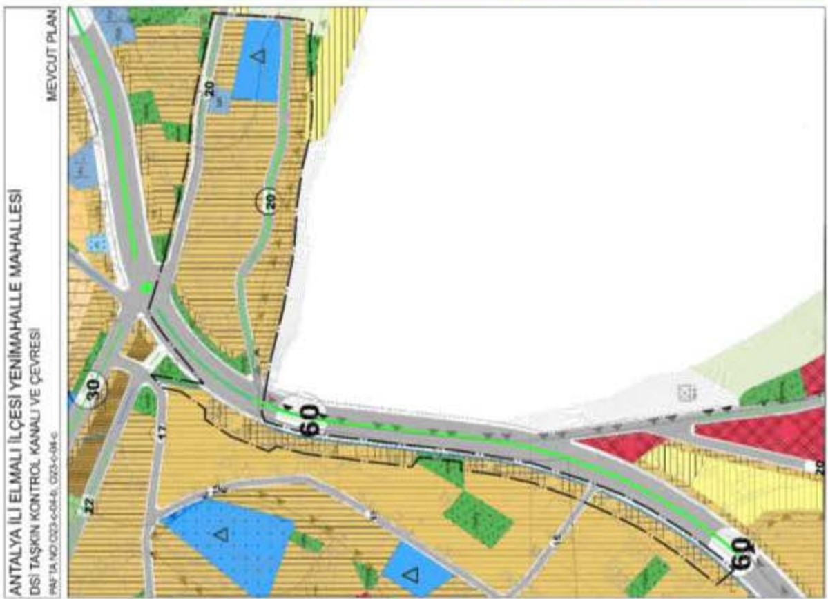
Şekil 6. Mevcut ve Öneri Nazım İmar Planı Değişikliği