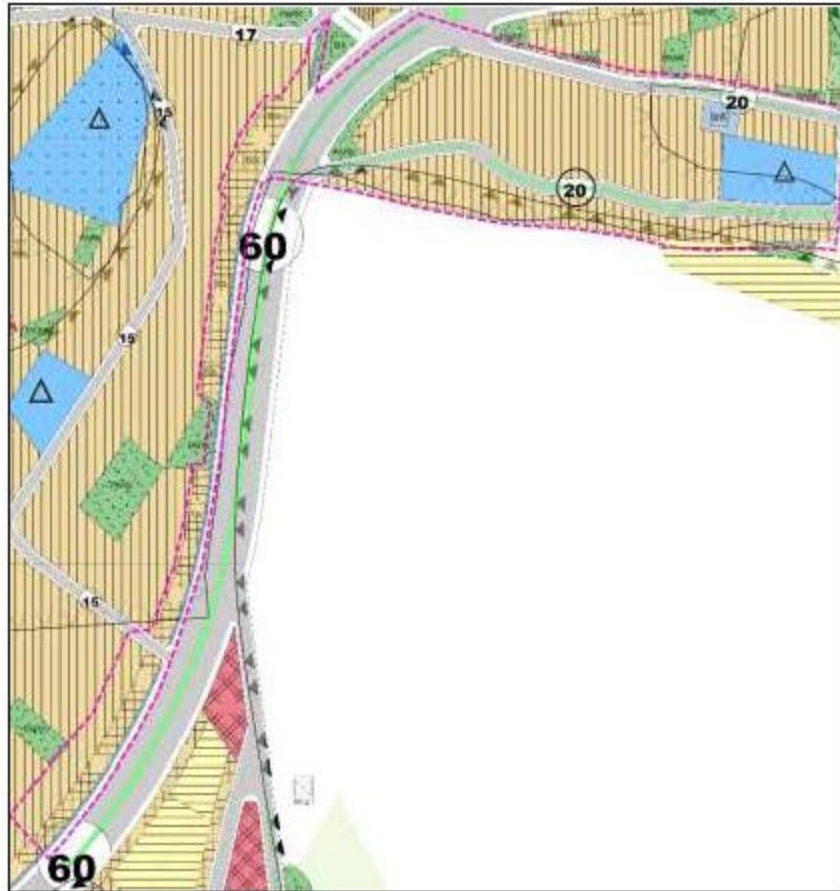
Şekil 4. Plan amaç konusuna ilişkin 1/5.000 Ölçekli Nazım İmar Planı'ndaki yerleşim alanları

Halen yürürlükte olan 1/1.000 Ölçekli Elmalı Uygulama İmar Planı Revizyonu'nda plan amaç alanı için üst ölçekte belirlenen arazi kullanım kararlarına uyulmuştur. İlave olarak karayolunun doęu kısmında 1.00 emsalle 5 kat, batı kısmında ise karayolu kenarındaki ticaret konut bölgelerinde 1.50 emsalle, dięer konut bölgelerinde 1.00 emsalle yine 5 kat yapılaşma kararı getirilmiştir. Üst ölçekli plandan gelen ulaşım sistemi 12, 10 ve 7 m genişlięinde önerilen yollarla desteklenmiştir. Park, belediye hizmet alanı gibi donatılar korunmuş, üst ölçekten gelen eğitim tesis alanı kararı ise ilkokul alanı olarak belirlenmiş, ayrıca uygun konumlarda trafo alanları oluşturulmuştur. DSI kanalı ise 3 m genişlięinde, çoęunlukla karayolunun batısında olmak üzere, karayolu refüjü ve park alanlarında tanımlanmıştır.