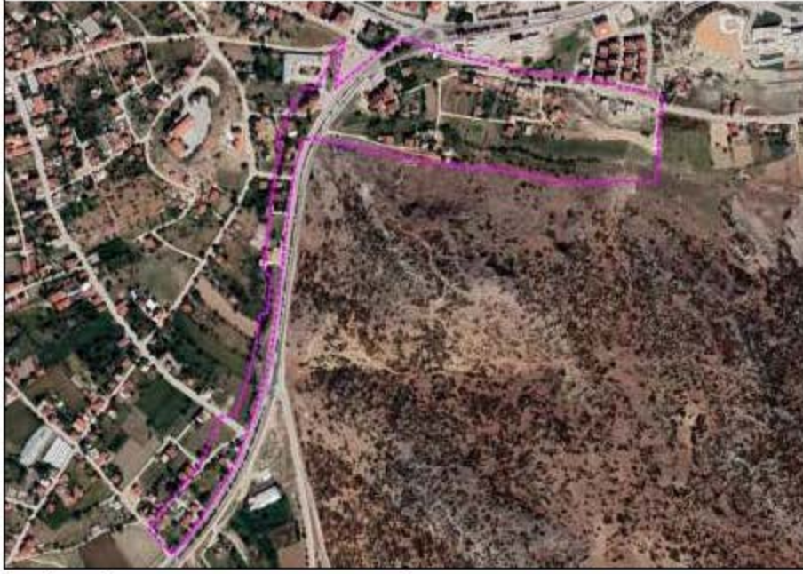
Şekil 1. Planlama konusu alan ve yakın çevresini gösteren uçuş görüntüsü

1/5.000 ölçekli nazım imar planı değişikliği teklifi Antalya İli, Elmalı İlçesi, Yenimahalle Mahallesi sınırlarında, O23-c-04-b ve O23-c-04-c no.lu 1/5.000 ölçekli hâlihazır daftalarında kalar, Devlet Su İşleri (DSİ) "Elmalı İlçe Merkezi Taşkın Kontrolü İşleri Projesi" kapsamındaki dere yataklarını ve çevresini kapsamaktadır. Planlama alanı yüz ölçümü yaklaşık 14,6 ha olup Korkuteli-Finike Karayolu nun Elmalı kent girişindeki kavşağın doğu ve güney batı yönündedir.