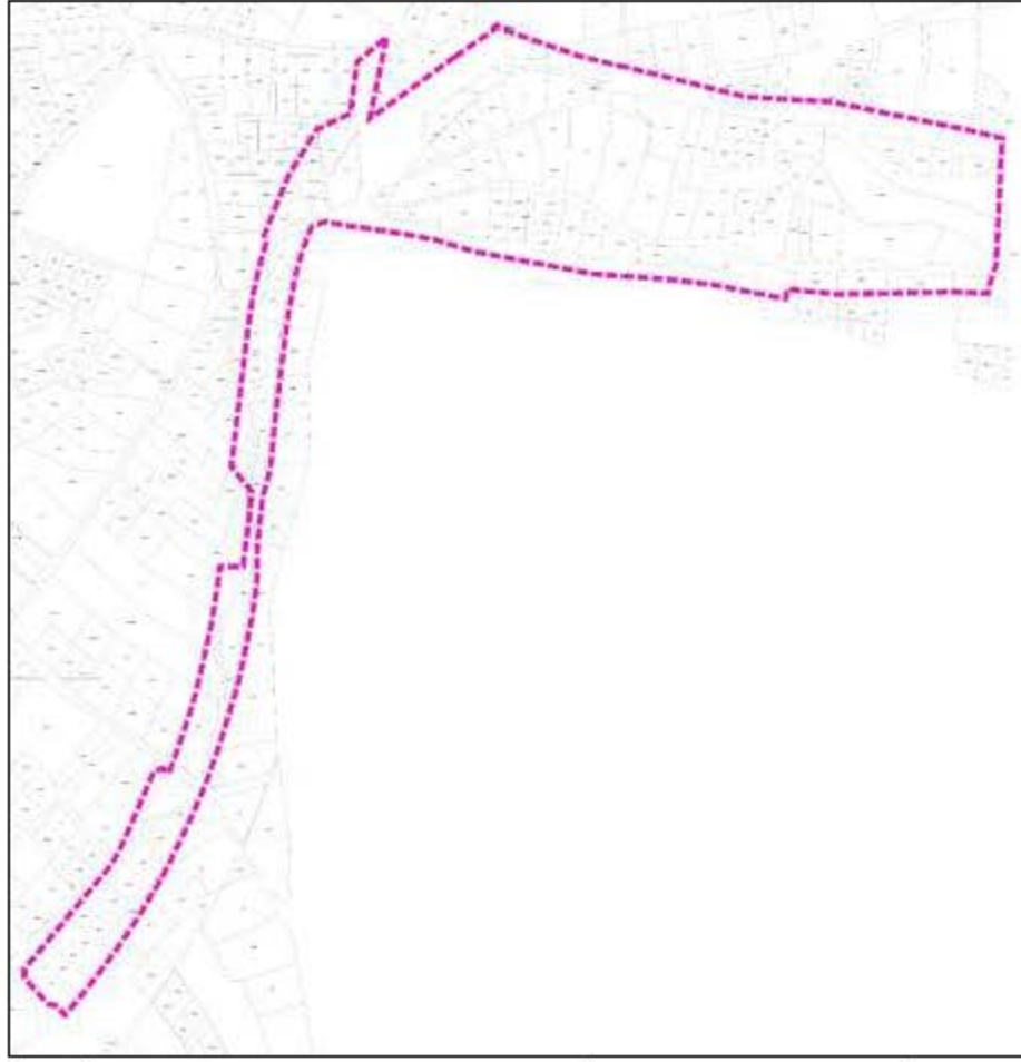
Şekil 2. Taşınmazlar ve çevresinin mülkiyet sınır arını gösterir kroki