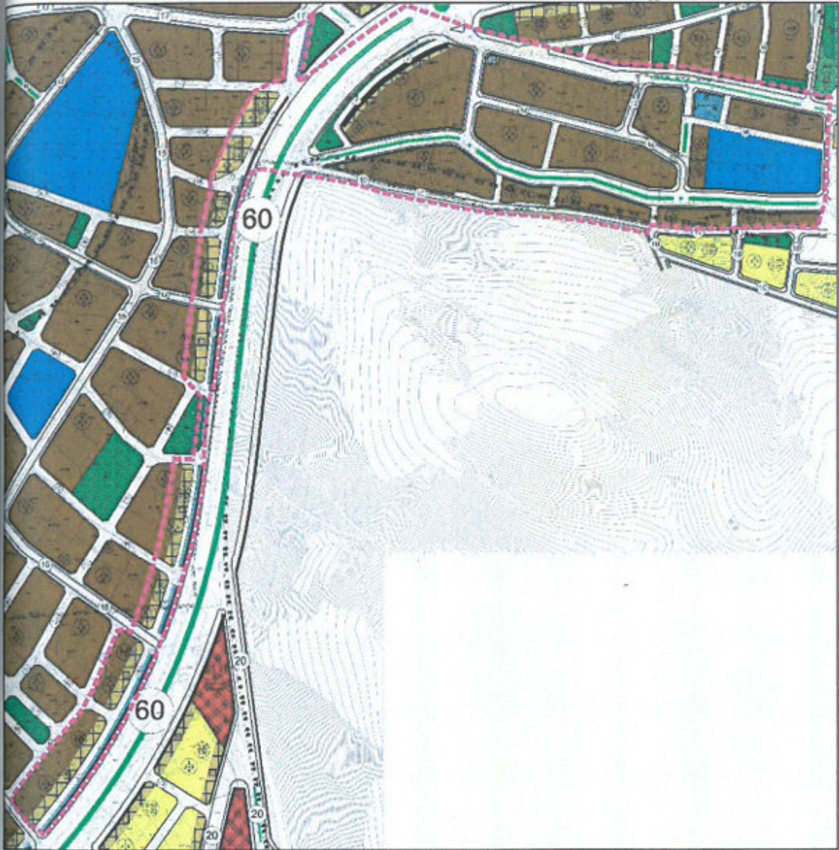
Şekil 5. Planlama konusu alanın 1/1.000 Ölçekli Uygulama İmar Planı'ndaki yeri