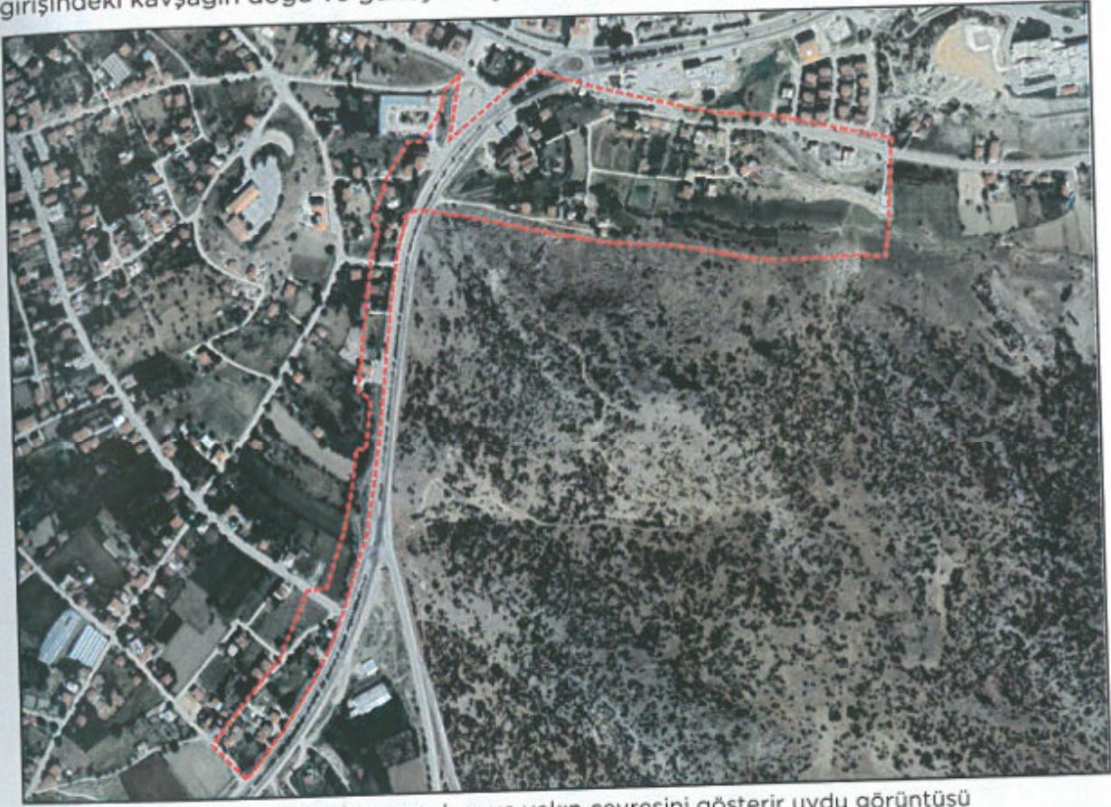
Şekil 1. Planlama konusu alanı ve yakın çevresini gösterir uydu görüntüsü

1/1.000 ölçekli uygulama imar planı değişikliği teklifi Antalya İli, Elmalı İlçesi, Yenimahalle Mahallesi sınırlarında, O23-c-04-b-4-c, O23-c-04-b-4-d ve O23-c-04-c-1-a no.lu 1/1.000 ölçekli hâlihazır paftalarında kalan, Devlet Su İşleri (DSİ) "Elmalı İlçe Merkezi Taşkın Kontrolü İşi Kati Projesi" kapsamındaki dere yataklarını ve çevresini kapsamaktadır. Planlama alanı 14,6 ha olup Korkuteli-Finike Karayolu'nun Elmalı kent girişindeki kavşağın doğu ve güneybatı yönündedir.