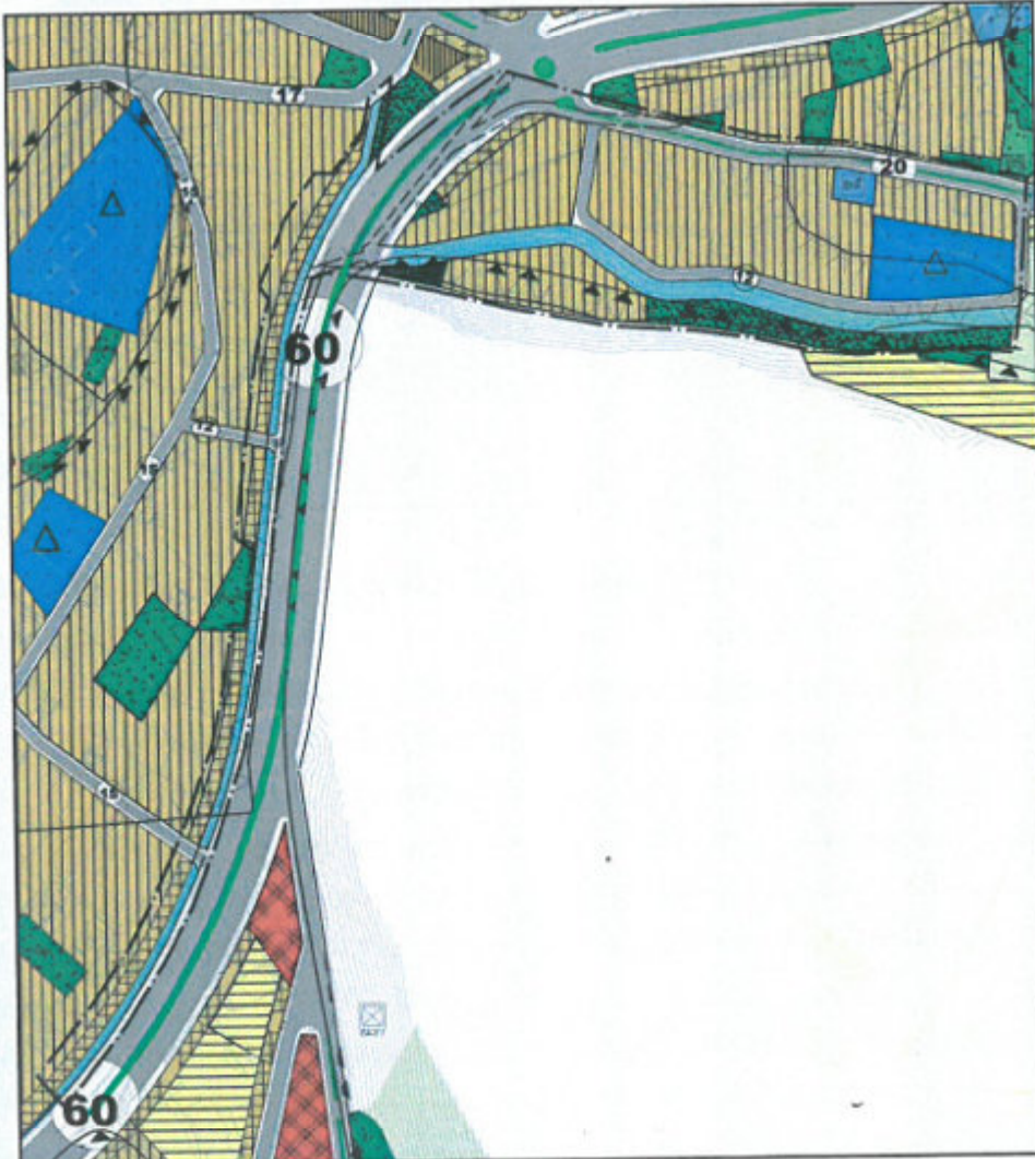
Şekil 4. Planlama konusu alanın 1/5.000 Ölçekli Nazım İmar Planı'ndaki yeri

Hâlen yürürlükte olan 1/1.000 Ölçekli Elmalı Uygulama İmar Planı Revizyonu'nda planlama alanı için üst ölçekte belirlenen arazi kullanım kararlarına uyulmuştur. İlave olarak karayolunun doğu kısmında 1.00 emsalle 5 kat, batı kısmında ise karayolu kenarındaki ticaret-konut bölgelerinde 1.50 emsalle, diğer konut bölgelerinde ise 1.00 emsalle yine 5 kat yapılaşma kararı getirilmiştir. Üst ölçekli plandan gelen ulaşım sistemi 7, 10 ve 12 m genişliğinde önerilen yollarla desteklenmiştir. Park, belediye hizmet alanı gibi donatılar korunmuş, üst ölçekten gelen eğitim tesis alanı kararı ise ilkokul alanı olarak belirlenmiş, ayrıca uygun konumlarda trafo alanları oluşturulmuştur. DSİ kanalı ise 3 m genişliğinde, çoğunlukla karayolunun batısında olmak üzere, karayolu refüjü ve park alanlarında tanımlanmıştır.