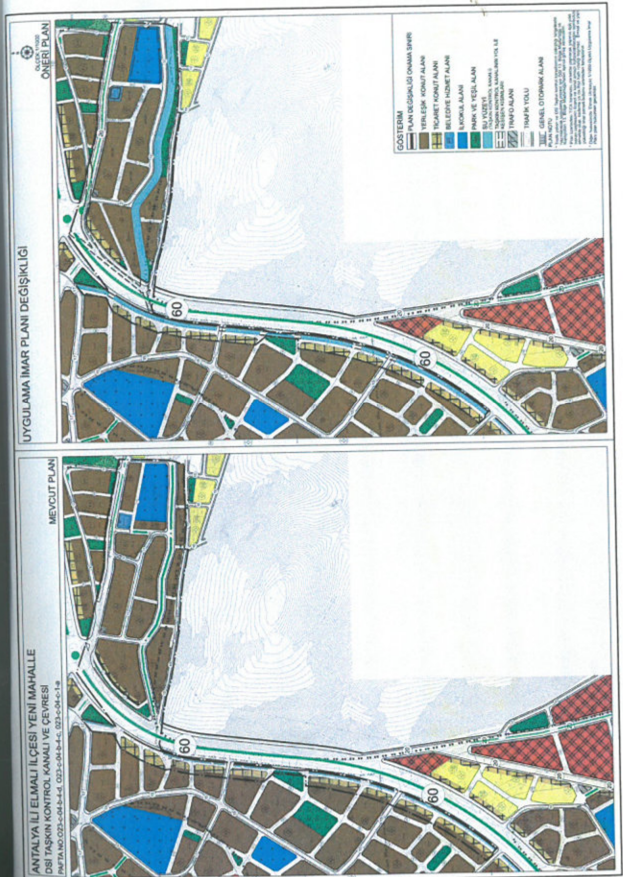
Şekil 6. Mevcut ve Öneri Uygulama İmar Planı Değişikliği