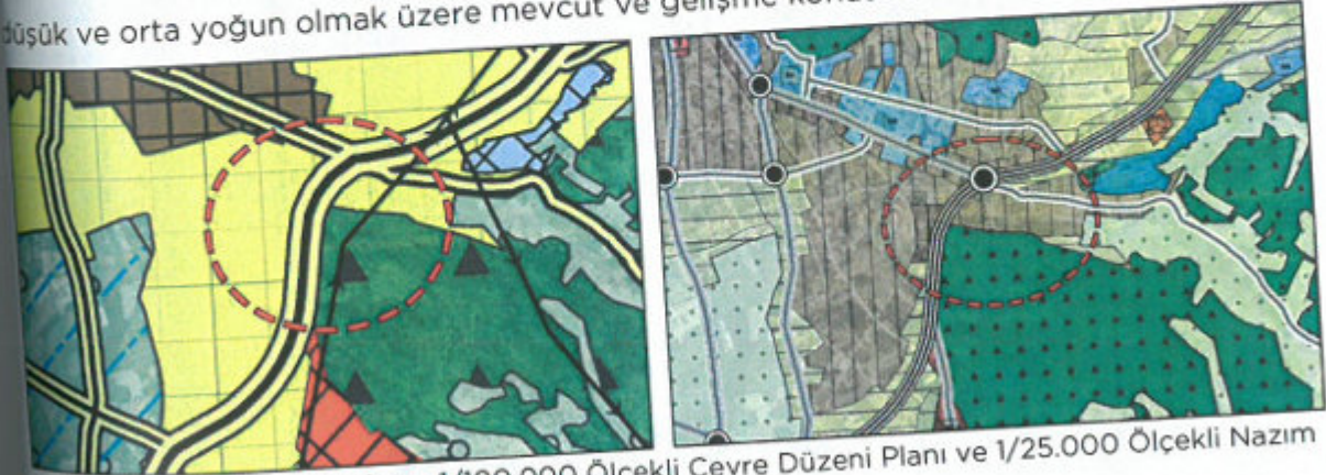
Şekil 3. Planlama konusu alanın 1/100.000 Ölçekli Çevre Düzeni Planı ve 1/25.000 Ölçekli Nazım İmar Planı'ndaki yeri

Bölge, Antalya-Burdur-Isparta Planlama Bölgesi 1/100.000 Ölçekli Çevre Düzeni Planı'nda kentsel gelişme alanı ve Antalya Büyükşehir Belediyesi'nce 09.12.2019 tarihinde onaylanan Antalya İli Elmalı İlçesi 1/25.000 Ölçekli Nazım İmar Planı'nda düşük ve orta yoğun olmak üzere mevcut ve gelişme konut alanı olarak tanımlanmıştır.