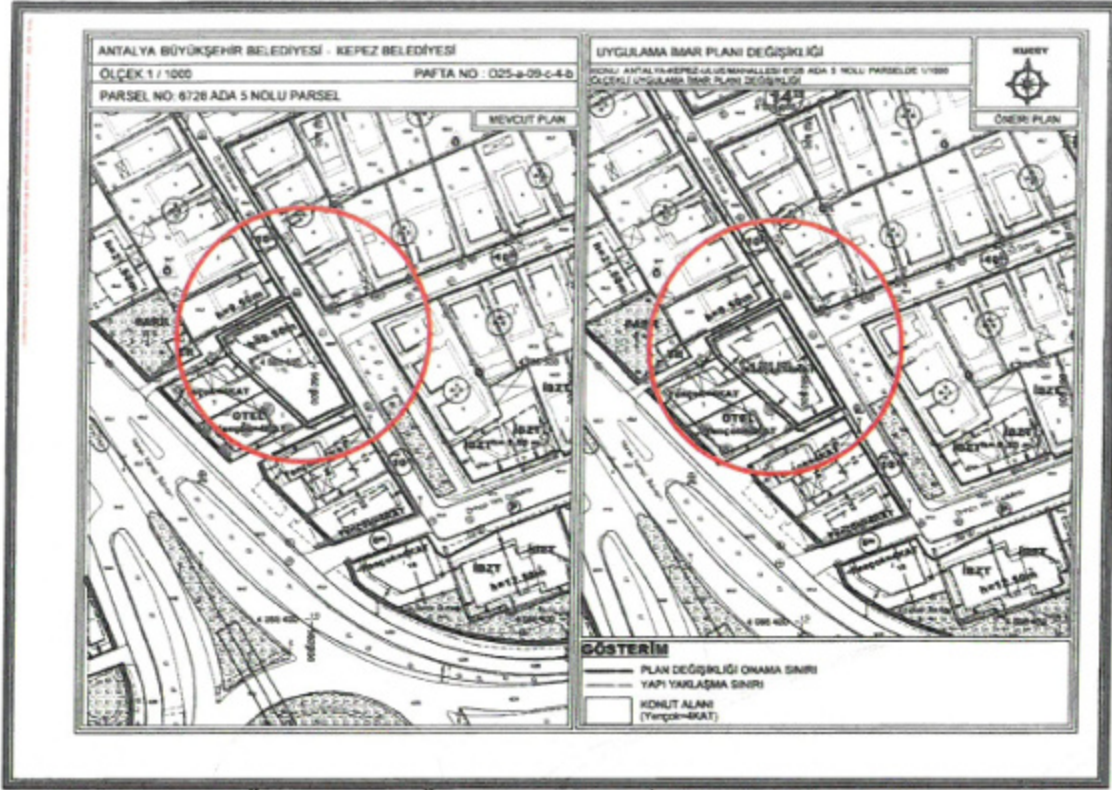
Şekil 6. Mevcut ve Öneri 1/1000 Ölçekli Uygulama İmar Planı Değişikliği

Uygulama İmar Planı Değişikliği Önerisi; ana plan kararlarını bozmadan, ulaşım sisteminde arazi kullanımlarının konumunda, yoğunluğunda değişiklik yapılmadan, plan bütünüyle uyumlu olacak şekilde, şehircilik ilkelerine uygun, kamu yararı amacıyla hazırlanmıştır.