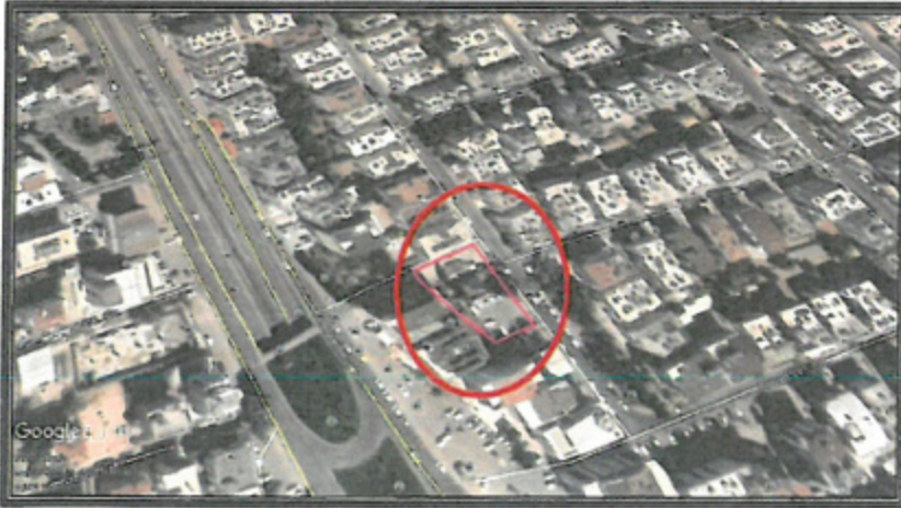
Şekil 2. Planlama Alanının Uydu Fotoğrafi