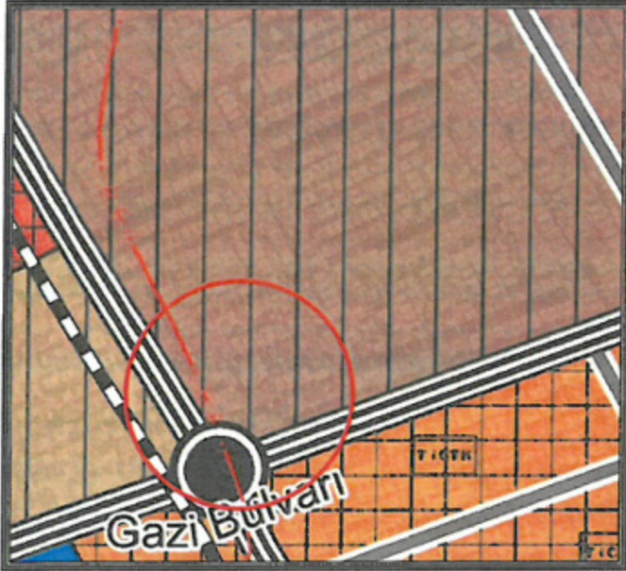
5. Kepez İlçesi 1/25000 Ölçekli Nazım İmar Planı

Öneri 1/1000 ölçekli Uygulama İmar Planı Değişikliğinde; "Konut Alanı" kullanım fonksiyonu aynen devam ettirilmiş olup yapı kullanma koşulu mevcut adada yapı yüksekliğinin 4 kat olması ve ada bütünlüğüne uyumlu hale getirmek amacıyla kat yüksekliği 4 kat olarak önerilmektedir. Planlama alanında yapı yaklaşma mesafeleri tüm cephelerden 5'er metre şeklinde düzenlenmiştir.