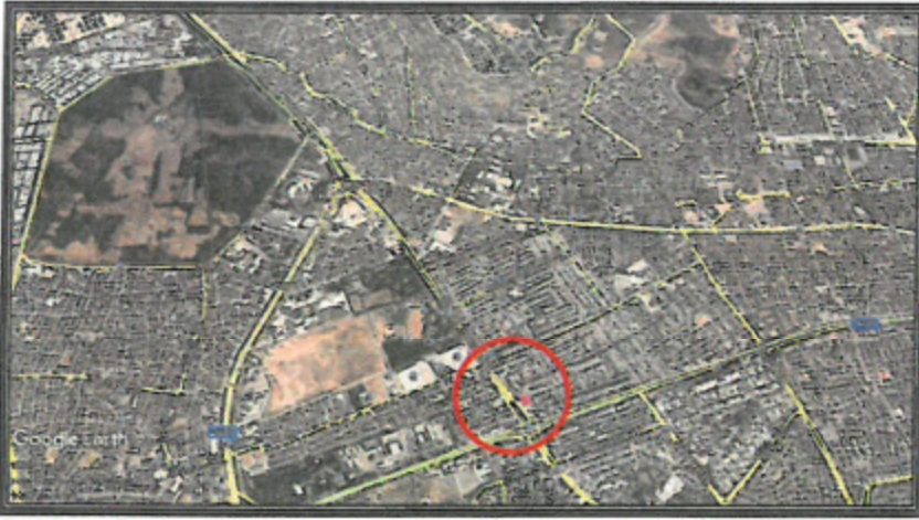
Şekil 1. Genel Bölgenin Uydu Fotoğrafi

Antalya İli Kepez İlçesi, Ulus Mahallesi; O25A-09C-4B numaralı 1/1000 ölçekli Uygulama İmar Planı paftası sınırları içerisinde yer alan 6728 ada 5 nolu parselde 1/1000 ölçekli Uygulama İmar Planı Değişikliği yapılmaktadır.