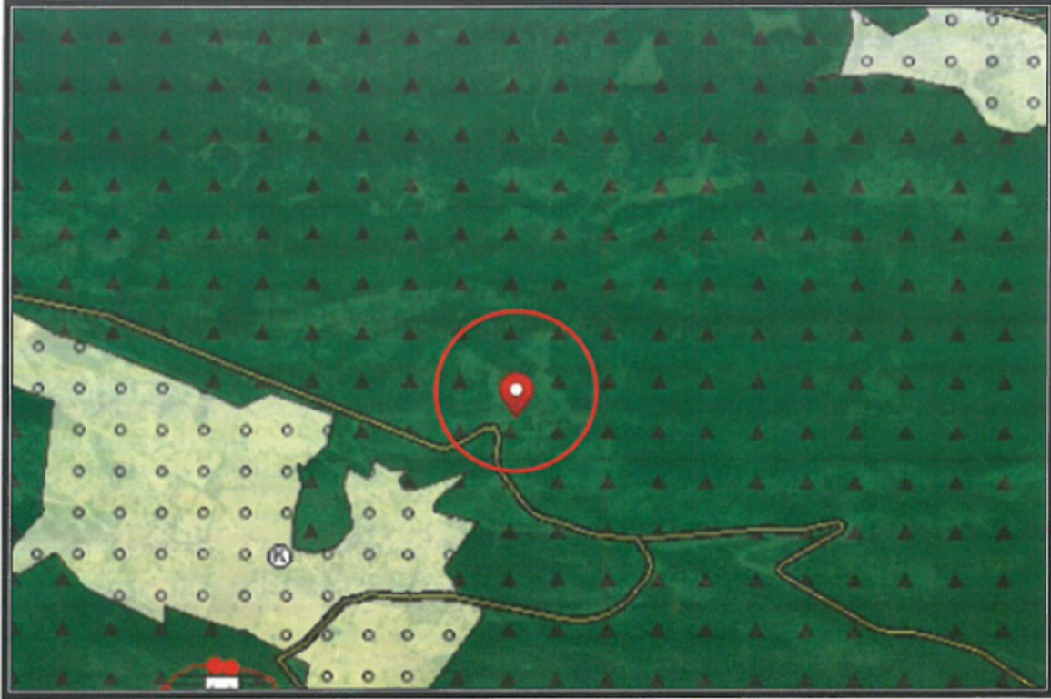
4. Antalya-Burdur-Isparta Planlama Bölgesi 1/100000 Ölçekli Çevre Düzeni Planı