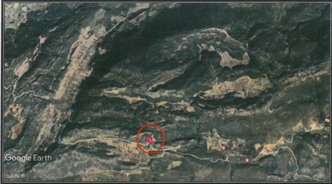
1. Genel Uydu Görüntüsü

Antalya İli, Kaş İlçesi, Gökçeören Mahallesi sınırlarında yer alan P23-D1 nolu 1/25000 Ölçekli Nazım İmar Planı paftasında kalan 225 ada 1 ve 6 nolu parsellerde 1/25000 Ölçekli Nazım İmar Planı Değişikliği yapılmaktadır.