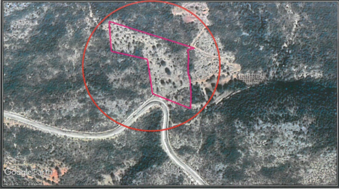
2. Planlama Alanı Uydu Görüntüsü