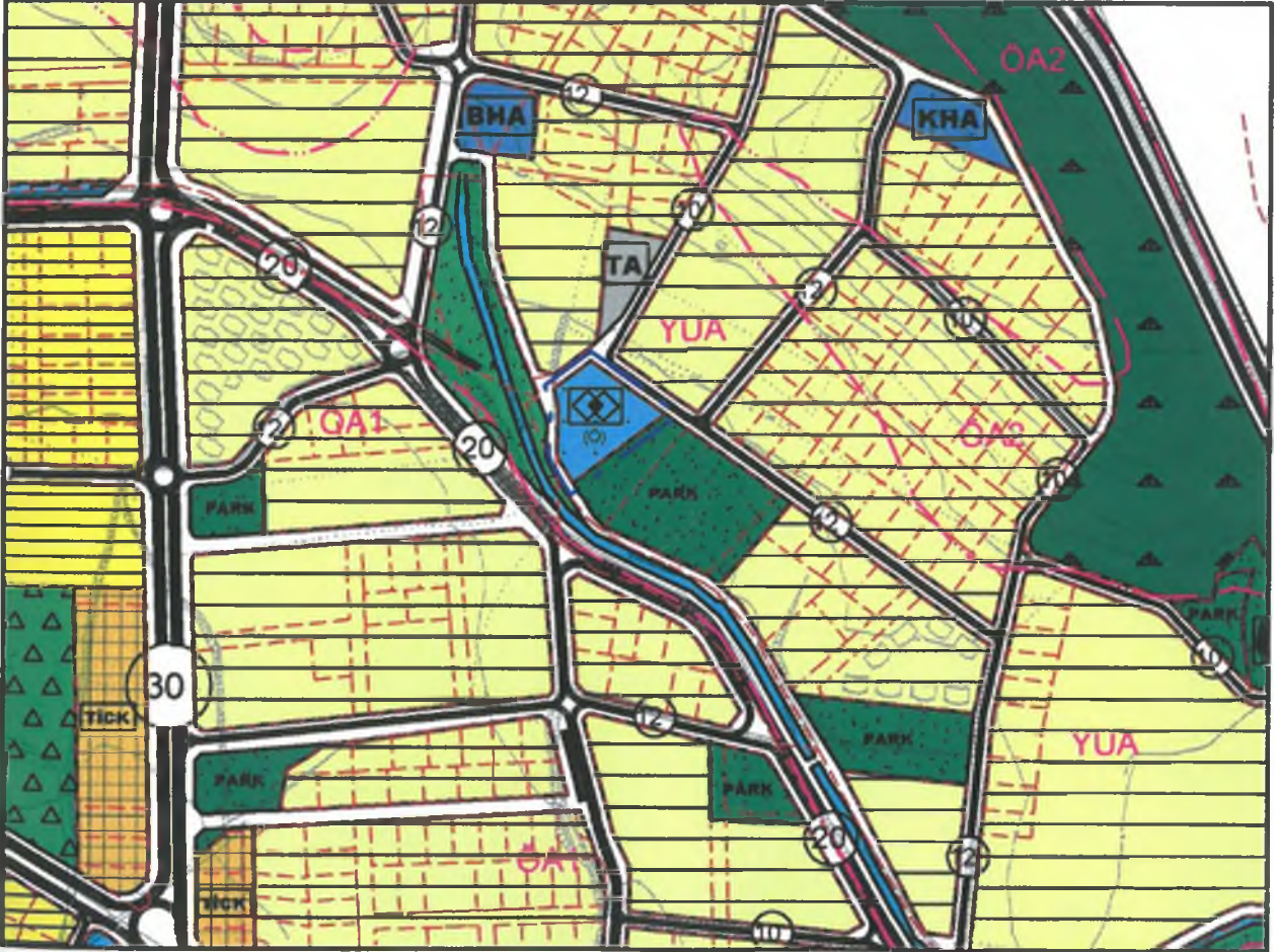
Sekil 3: Öneri 1/5000 Ölçekli Nazım İmar Planı Değişikliği

Plan ve plan notlarında belirtilmeyen durumlarda 1/5000 ölçekli "Ilıca (Manavgat-Antalya) Oymapınar KTKGB-İlıca Kesimi Revizyon Nazım İmar Planı" plan hükümleri bu plan değişikliği için de geçerlidir.