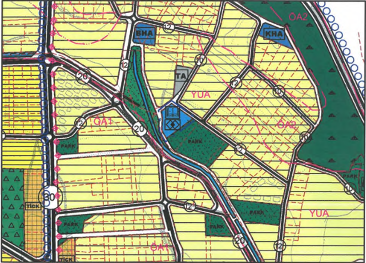
Sekil 2: Meri 1/5000 Ölçekli Nazım İmar Planı

Meri uygulama imar planında bahse konu alan doğusundan 12 metrelik taşıt yoluna cephesi bulunmakla birlikte alanında yakın çevresinde güneyinde "Park Alanı", kuzeyinde ve doğusunda "Konut Alanı", batısında kuzey-güney doğrultusunda "Su Yüzeyi (Dere, Kanal vb.)" bulunmaktadır.