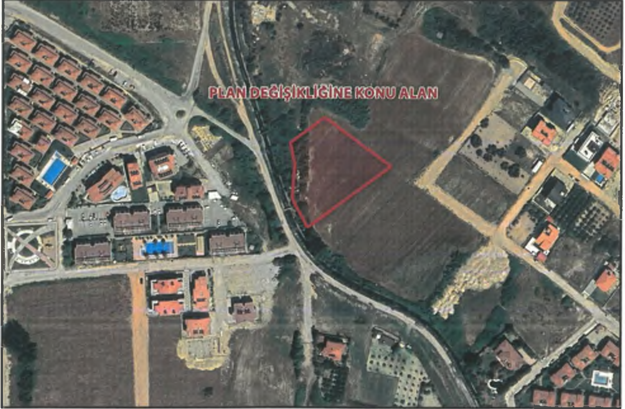
Sekil 1: Plan Değişikliğine Konu Alanın Uydu Görüntüsü

Alan konum olarak Ilica Mahallesi sınırları içerisinde yer almakta olup yakın çevresinde Madımak Sitesi, Ilica Park Sitesi, mevcut konut alanları ve güneyinde İnönü Bulvarı, D400 Karayolu bulunmaktadır.