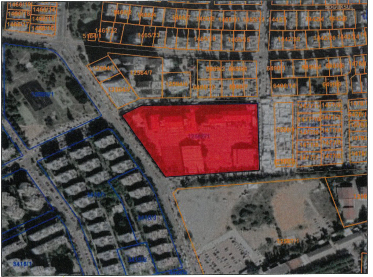
Şekil 2. Kadastral Durum ve Uydu Görüntüsü