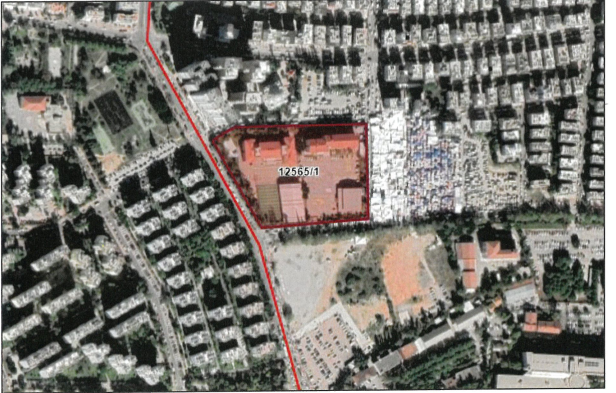
Şekil 1.Hava Fotoğrafi

Plan değişikliğine konu alan; Antalya ili, Muratpaşa İlçesi, Soğuksu Mahallesi sınırları dahilinde, 12565 ada 1 nolu parseldeki okul alanı 20J-3B nolu 1/1000 Ölçekli Uygulama İmar Planı paftasında kalmaktadır.