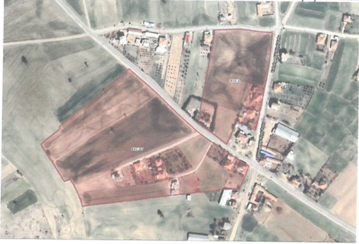
Görsel 2:Planlama Alanı Yakın Uydu Görüntüsü