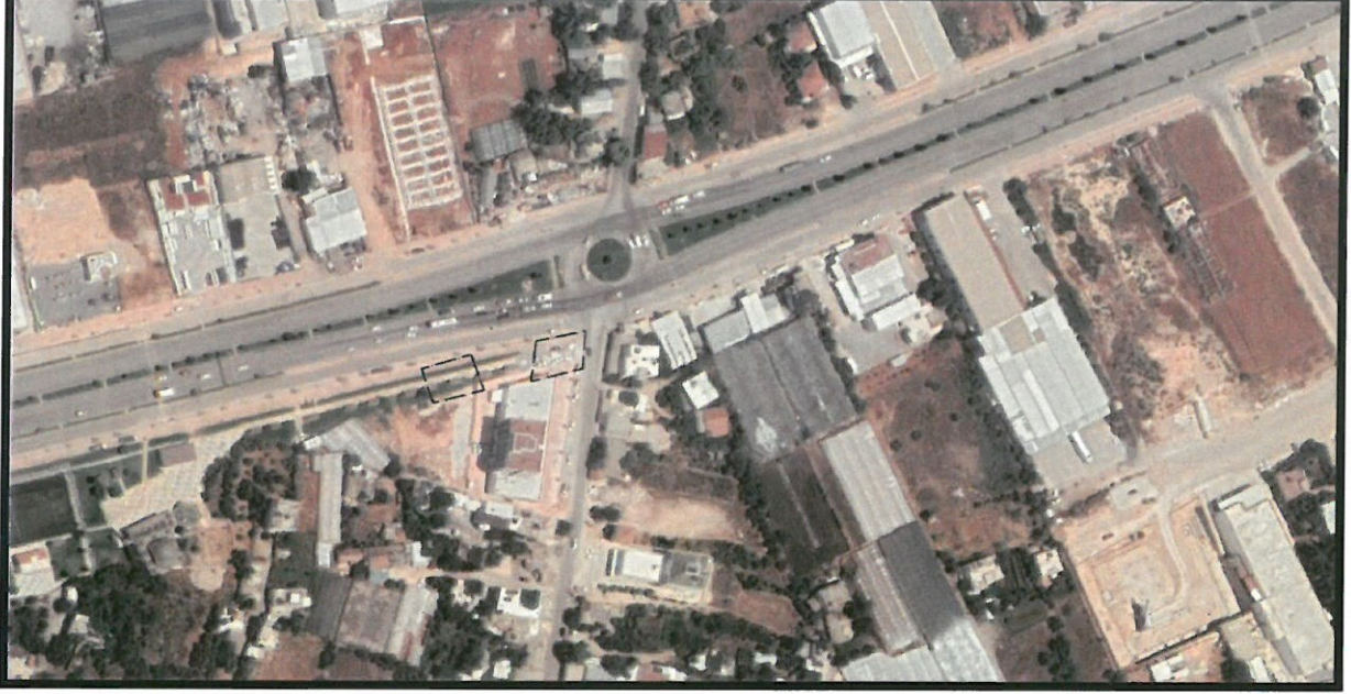
Resim 1: Uydu Görüntüsü

Plan revizyonu; Antalya İli, Kepez İlçesi, Altınova Düden Mahallesi, 28597 ada kuzeyini kapsamaktadır (Bkz: Resim 1 ve 2).