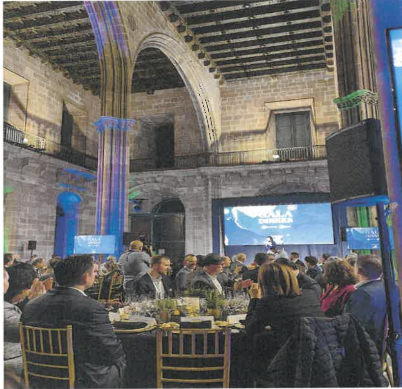
Resim 6. EIT Urban Mobility'nin düzenlediği Gala yemeği (EIT Urban Mobility üyesi şehirlerin ve firmaların katılımı ile)