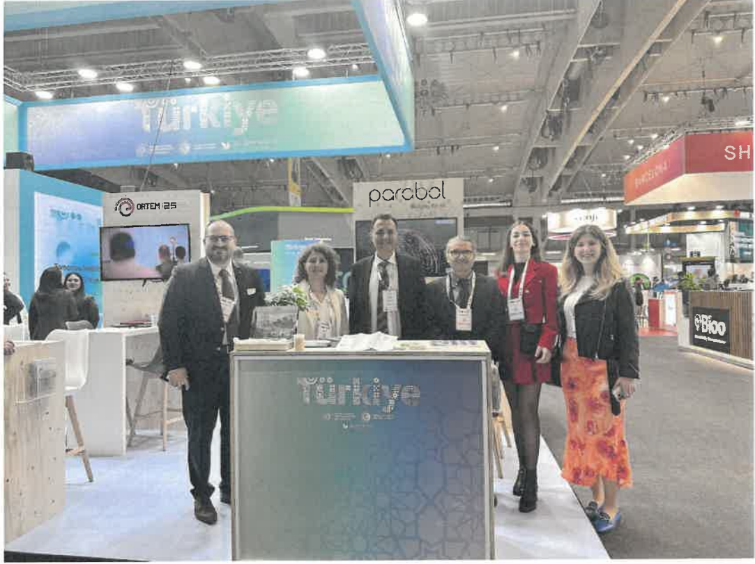
Resim 3. Antalya Büyükşehir Belediyesi ekibi Parabol standında