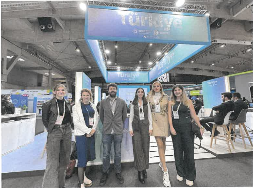
Resim 4. Antalya Büyükşehir Belediyesi ekibi MiGriS projesi ortaklarıyla (Berlin Teknik Üniversitesi, Dugopolje Belediyesi, EIT Urban Mobility)