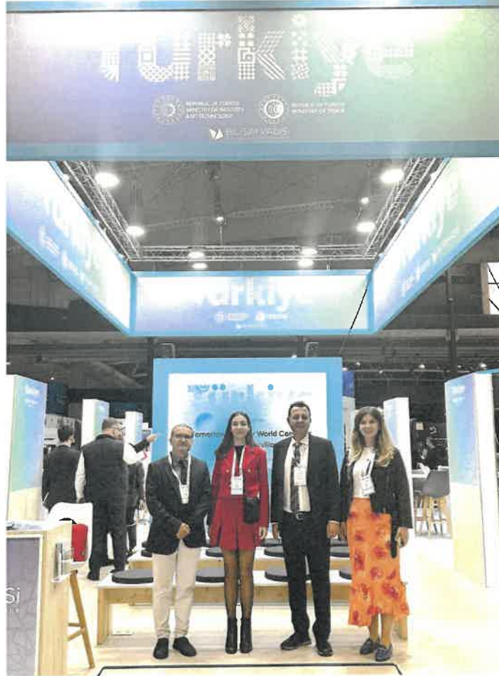
Resim 1. Antalya Büyükşehir Belediyesi ekibi Türkiye pavilyonunda