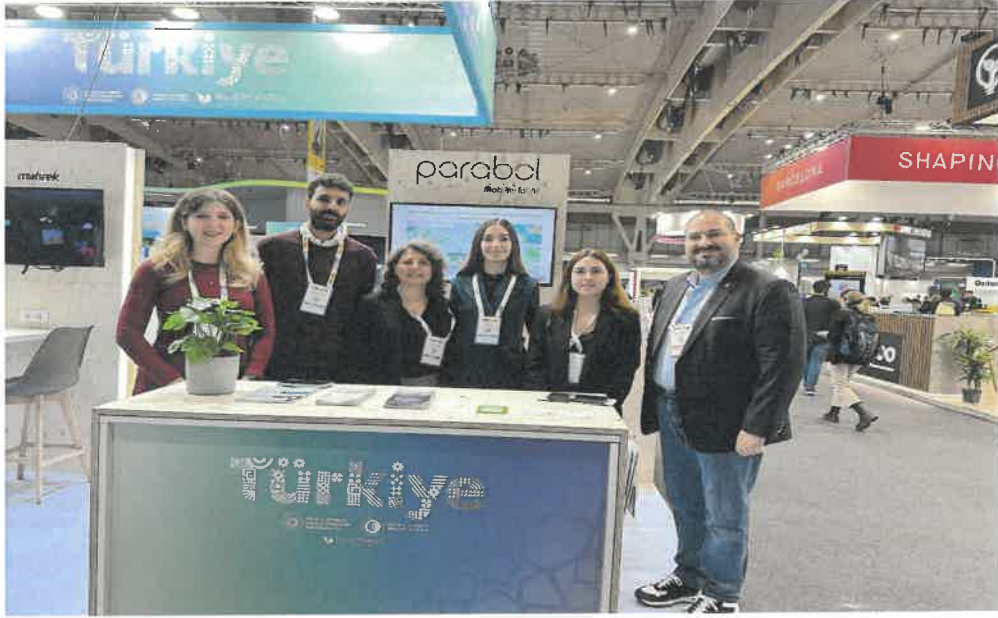
Resim 5. Antalya Büyükşehir Belediyesi, Cermoni projesi ortaklarıyla (Parabol, Vignola Belediyesi)