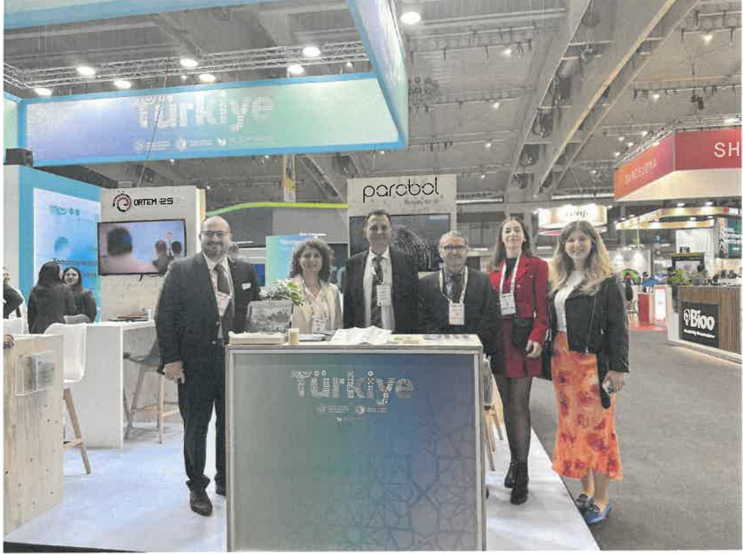
Resim 3. Antalya Büyükşehir Belediyesi ekibi Parabol standında