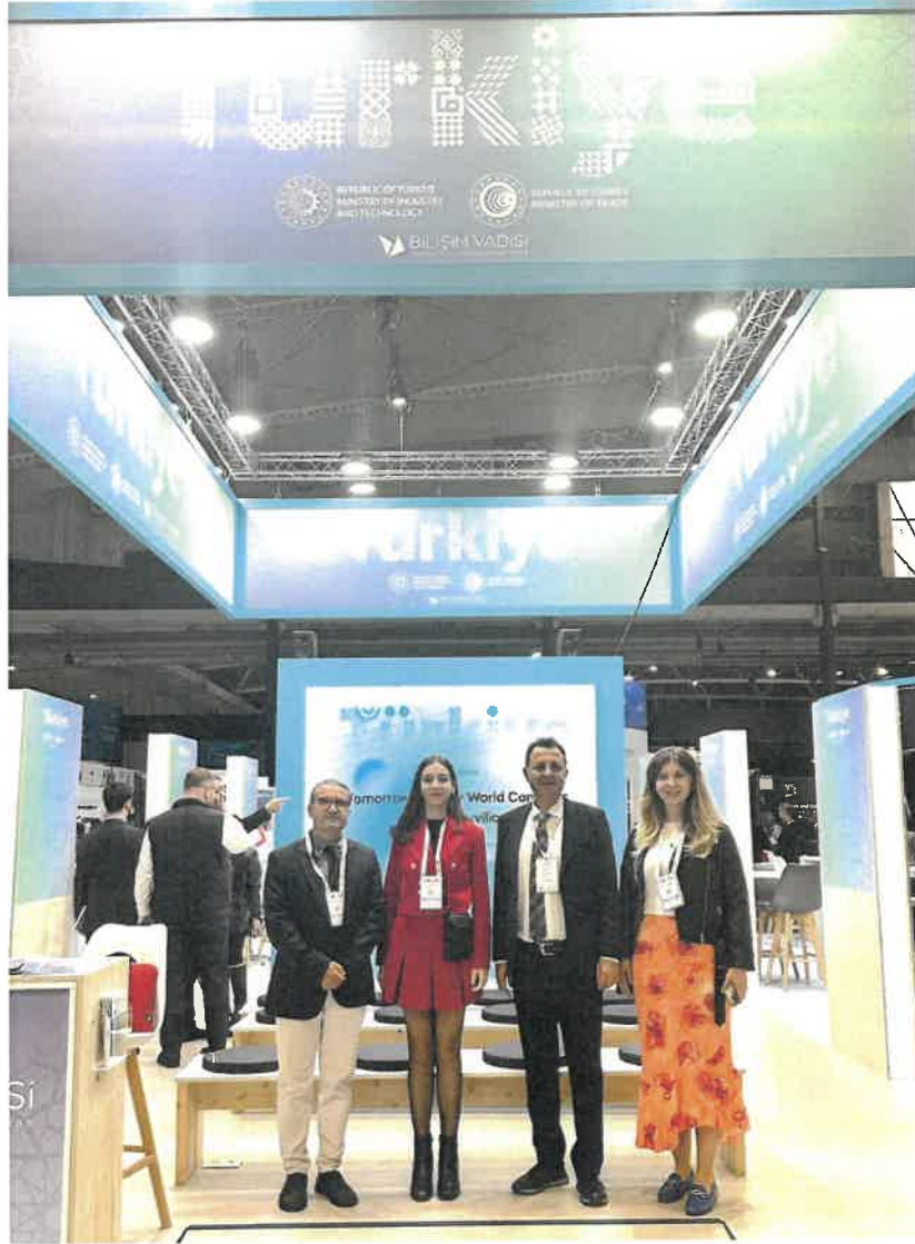
Resim 1 - Antalya Büyükşehir Belediyesi ekibi Türkiye pavilyonunda