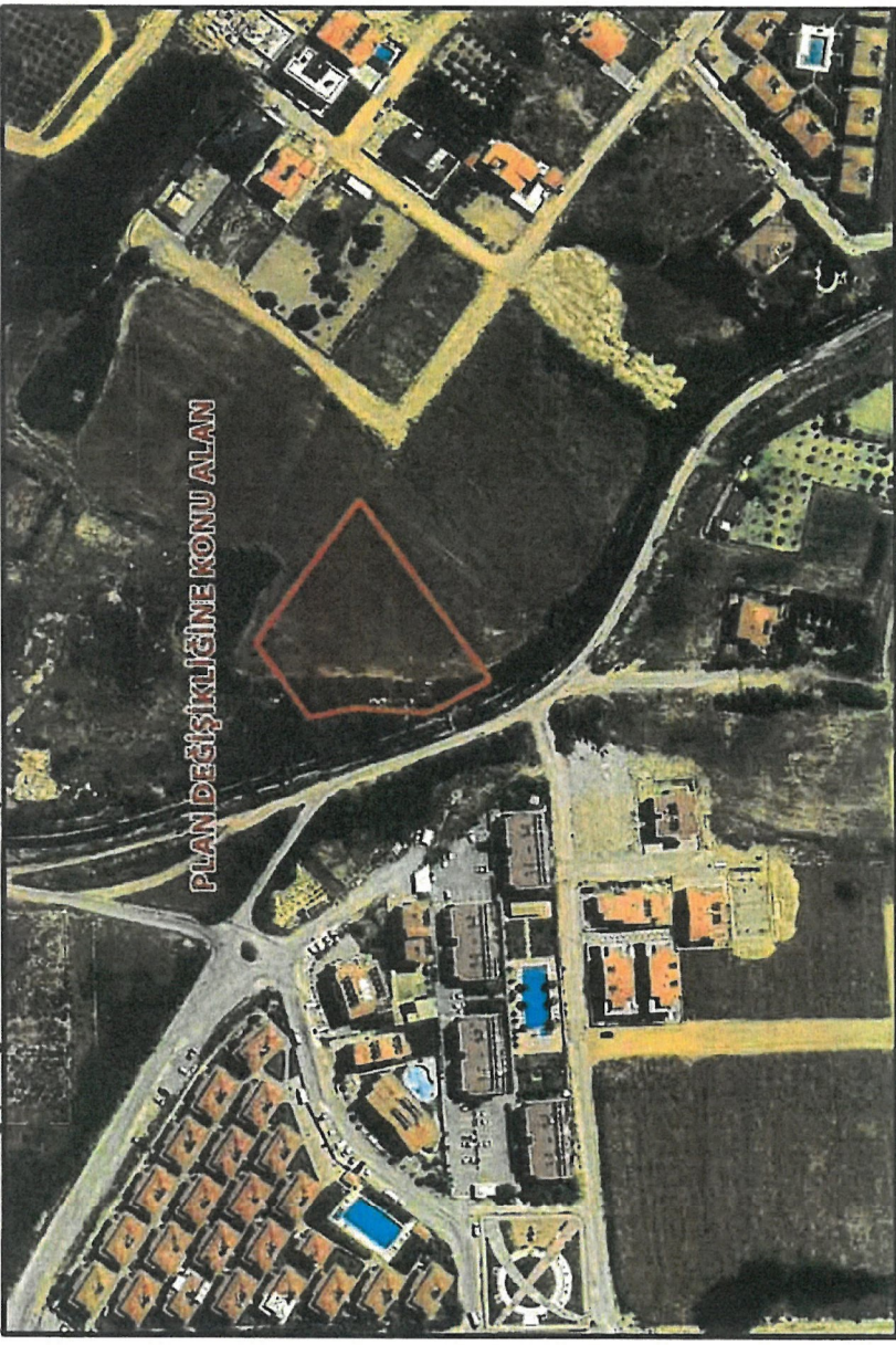
Şekil 1: Plan Değişikliğine Konu Alanın Uydur Görüntüsü

Alan konum olarak Ilıca Mahallesi sınırları içerisinde yer almakta olup yakın çevresinde Madımak Sitesi, Ilıca Park Sitesi, mevcut konut alanları ve güneyinde İnönü Bulvarı, D400 Karayolu bulunmaktadır.