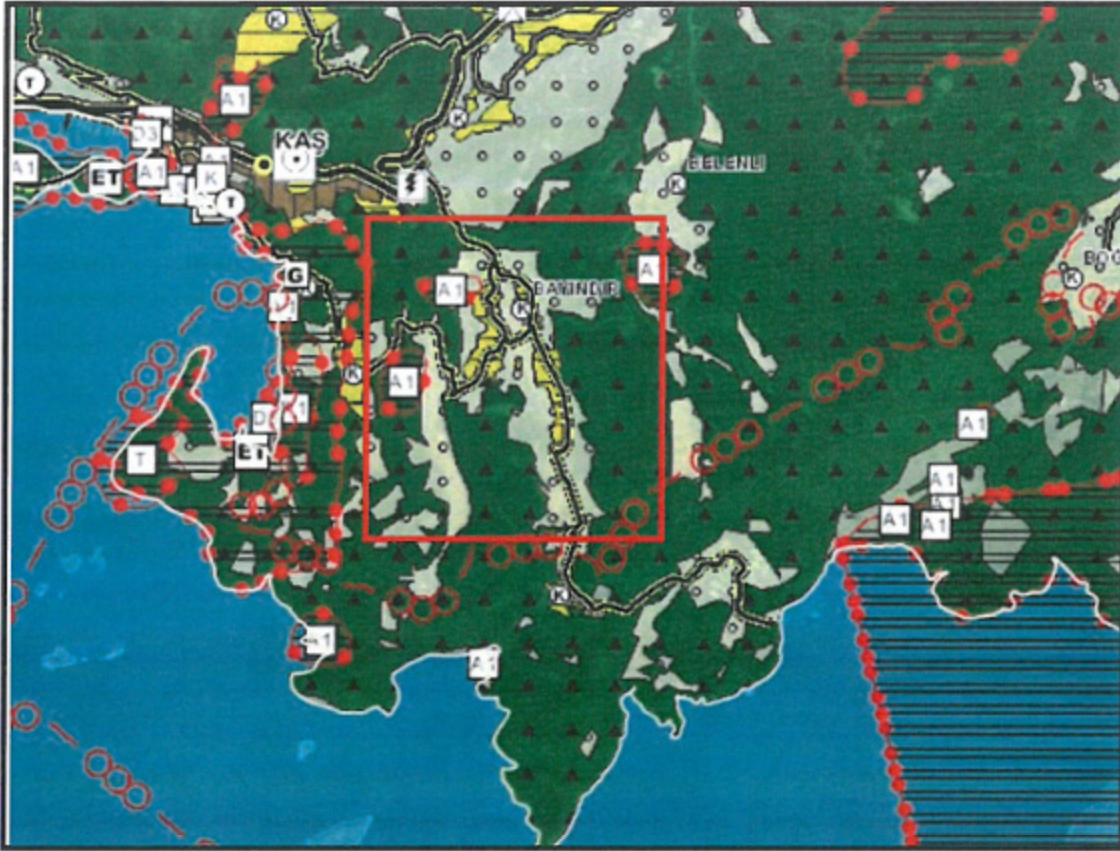
Harita 1: Planlama Alanı ve Yakın Çevresinin Antalya-Burdur-Isparta Planlama Bölgesi 1/100.000 Ölçekli Çevre Düzeni Planındaki Yeri

Antalya-Burdur-Isparta Planlama Bölgesi 1/100.000 Ölçekli Çevre Düzeni Planı Değişikliği; Çevre, Şehircilik ve İklim Değişikliği Bakanlığı 08/02/2022 tarihli ve 2913627 sayılı OLUR'u ile 1 Nolu Cumhurbaşkanlığı Kararnamesi'nin 102. Maddesi uyarınca onaylanmıştır. Planlama Alanı; Antalya-Burdur-Isparta Planlama Bölgesi 1/100.000 Ölçekli Çevre Düzeni Planı'nda P23 pafta sınırları içerisinde kalmakta olup; planda bu mahalle Kırsal Yerleşim Alanı, Orman Alanı ve Tarım Alanları olarak Harita 18'de gösterilmiştir.