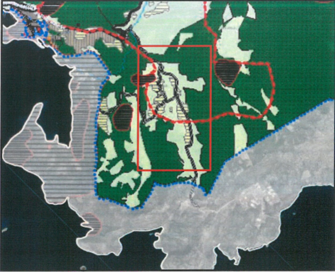
Harita 2: Planlama Alanı ve Yakın Çevresinin Kaş İlçesi 1/25.000 Ölçekli Nazım İmar Planındaki Yeri

Kaş Belediyesi ve Antalya Büyükşehir Belediyesi yetki alanında kalan ve Antalya Büyükşehir Belediyesi Meclisinin 14/11/2022 tarih ve 971 sayılı kararı ile onaylanan Kaş İlçesi 1/25000 ölçekli Nazım İmar Planında Bayındır Mahallesi "Kırsal Nitelikli Yerleşim Alanı" kapsamında kalmakta olup, bu doğrultuda Uygulama İmar plan çalışmaları yapılmaktadır.