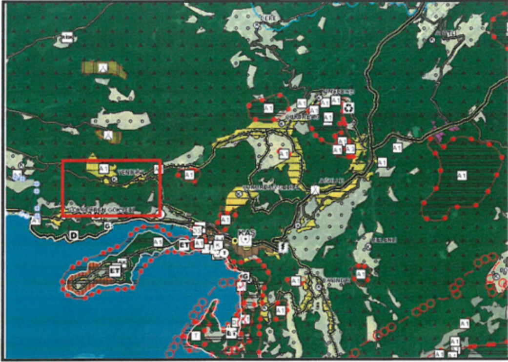
Harita 1: Planlama Alanı ve Yakın Çevresinin Antalya-Burdur-Isparta Planlama Bölgesi 1/100.000 ölçekli Çevre Düzeni Planındaki Yeri

Antalya-Burdur-Isparta Planlama Bölgesi 1/100.000 Ölçekli Çevre Düzeni Planı Değişikliği; Çevre, Şehircilik ve İklim Değişikliği Bakanlığı 08/02/2022 tarihli ve 2913627 sayılı OLUR'u ile 1 Nolu Cumhurbaşkanlığı Kararnamesi'nin 102. Maddesi uyarınca onaylanmıştır. Planlama Alanı; Antalya-Burdur-Isparta Planlama Bölgesi 1/100.000 Ölçekli Çevre Düzeni Planı'nda P23 pafta sınırları içerisinde kalmakta olup; planda bu mahalle Kırsal Yerleşim Alanı, Orman Alanı ve Tarım Alanları olarak Harita 15'de gösterilmiştir.