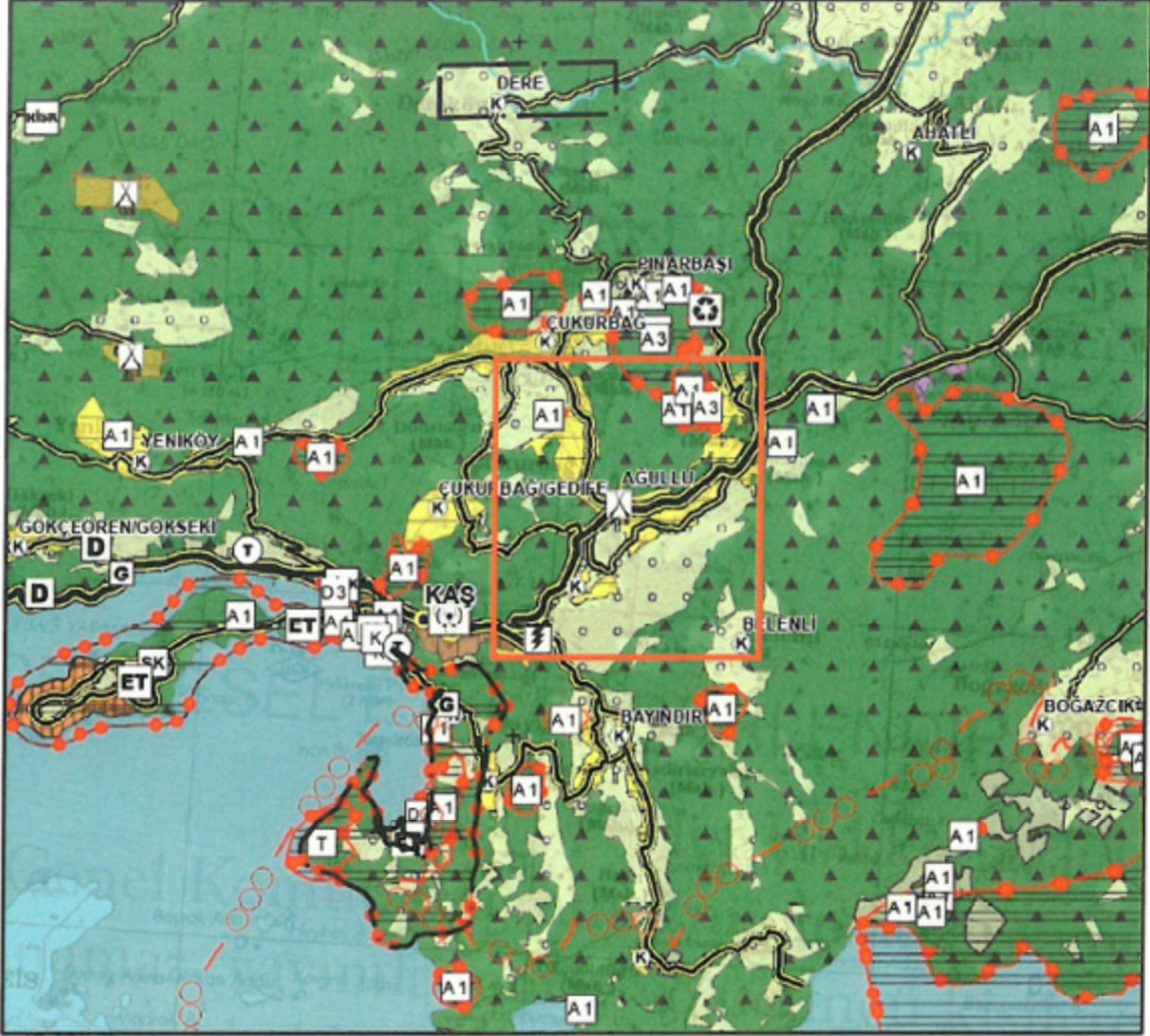
Harita 1: Planlama Alanı ve Yakın Çevresinin Antalya-Burdur-Isparta Planlama Bölgesi 1/100.000 ölçekli Çevre Düzeni Planındaki Yeri

Antalya-Burdur-Isparta Planlama Bölgesi 1/100.000 Ölçekli Çevre Düzeni Planı Değişikliği; Çevre, Şehircilik ve İklim Değişikliği Bakanlığı 08/02/2022 tarihli ve 2913627 sayılı OLUR'u ile 1 Nolu Cumhurbaşkanlığı Kararnamesi'nin 102. Maddesi uyarınca onaylanmıştır. Planlama Alanı; Antalya-Burdur-Isparta Planlama Bölgesi 1/100.000 Ölçekli Çevre Düzeni Planı'nda P23 pafta sınırları içerisinde kalmakta olup; planda bu mahalleler Kırsal Yerleşim Alanı, Orman Alanı ve Tarım Alanları olarak Harita 14'de gösterilmiştir.