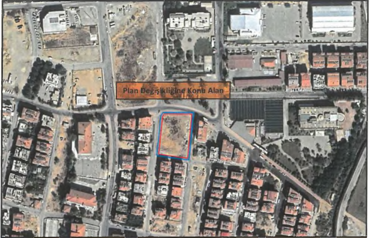
Sekil 1: Plan Değişikliğine Konu Alanın Uydü Görüntüsü

Alan konum olarak Emek Mahallesi sınırları içerisinde yer almakta olup yakın çevresinde Manavgat Meslek Yüksekokulu, Manavgat Kız ve Erkek Öğrenci Kredi Yurtları, Mehmet Akif Ersoy Kapalı Spor Salonu, Belediye Hizmet Alanı, Manavgat İlçe Emniyet Müdürlüğü ve mevcut konut alanları bulunmaktadır.