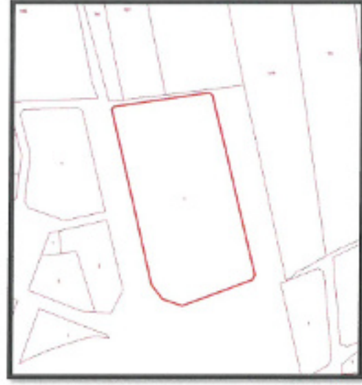
Görsel 2: Kadastral Durum

Antalya İli Finike İlçesi Hasyurt Mahallesi 256 ada 1 parsel ve çevresini kapsamaktadır. Çalışma alanı P24-A-20-C-2-A, P24-A-20-C-2-B ve P24-A-20-C-2-C imar paftasında olup, 3 adet halihazırda yer almaktadır. Planlama alanı yaklaşık olarak 4 Ha (40.004,40 m 2 ) dır.