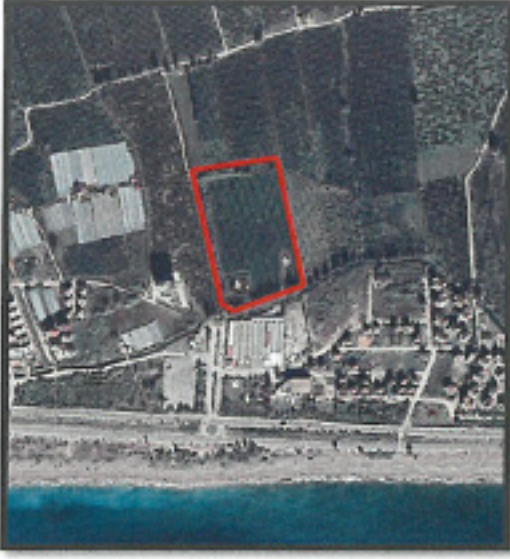
Görsel 1: Planlama Alanı Uydu Görüntüsü