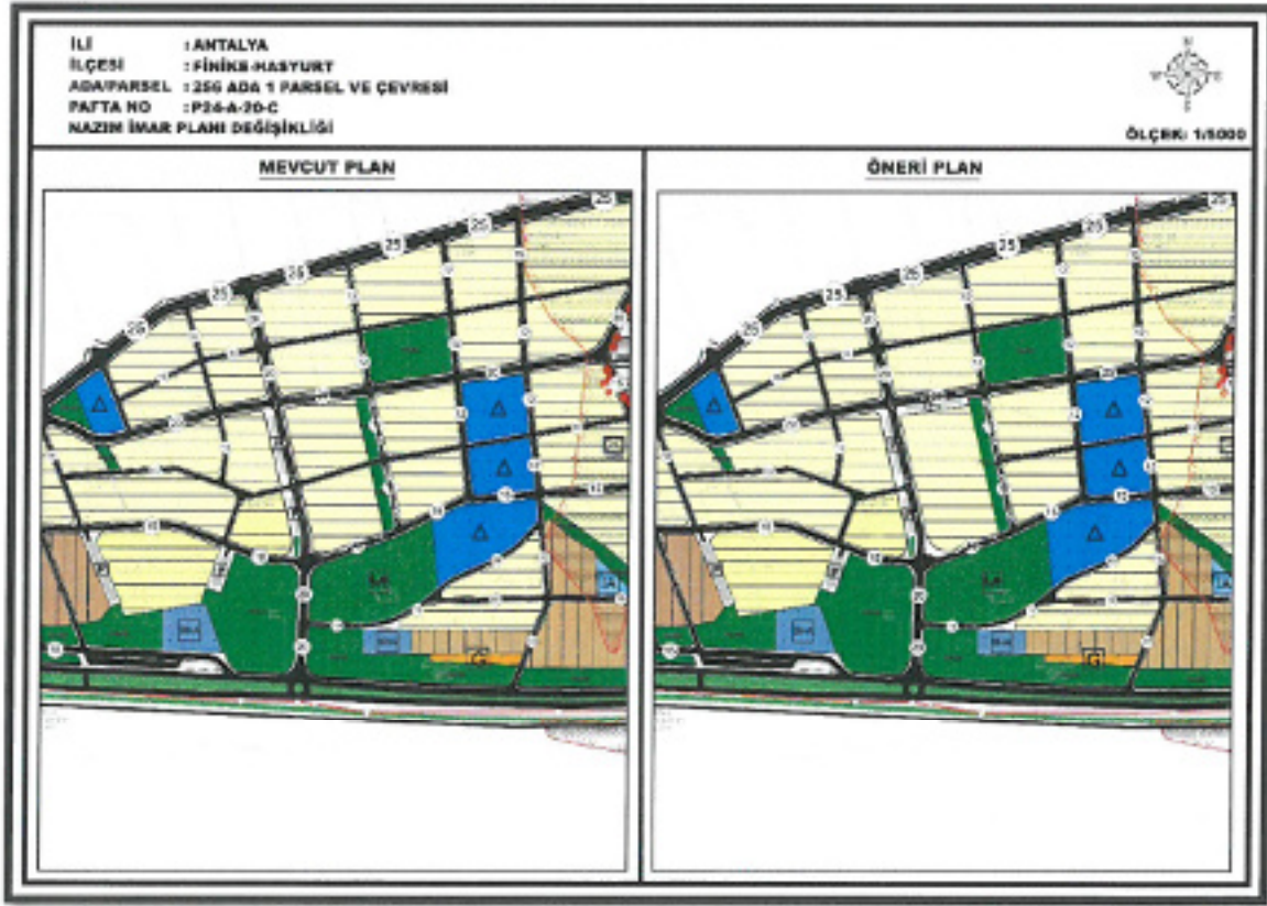
Görsel 5: Mevcut-Öneri İmar Plan Durumu

M. BAYAR Şehir Plancısı Dip.No: / Sic.No:3091 Kart. Dinya No:1653