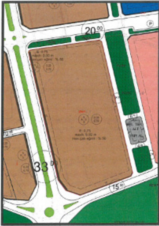
Görsel 3: İlave-Revizyon İmar Planı Öncesi İmar Durumu

Finike İlçesi Hasyurt Mahallesi 256 ada 1 parselin mevcut imar durumuna bakıldığında konut alanında kaldığı, parselin ortasından doğu-batı istikametinde 10 m yol geçmekte olup E=0.75 , Yençok= 5 Kat yapılaşma koşullarına sahip 2 adet konut adasının olduğu görülmektedir. Bahse konu parsel için kadastro durumu incelendiğinde parselin Finike Merkez – Sahilkent – Yeşilyurt – Turunçova – Hasyurt Mahallerini kapsayan İlave+Revizyon İmar planı öncesine ait imar planı durumuna göre İfraz, yol ve park alanına terk işlemlerinin yapıldığı görülmektedir. Oluşan parsel üzerine inşaat yapılabilmesi için 2007 ve 2008 yıllarında yapı ruhsatları verilmiştir(Ek-1). İlave+Revizyon İmar Planı ve 2022 yılında Hasyurt mahallesinde yapılan değişik sonrası parsel üzerinden geçen 10 metrelik yol önerilmiş olup parselde ruhsata uygun yapılaşma ve inşaat alanı hakkı ortadan kalkmıştır. 256 ada 1 parselde yer alan konut adalarına çevre parseller, kadastro boşlukları dahil olmakta ve terk-ihdas işlemleri gerektirmektedir. Bahse konu parsel ve çevresinde uyumsuzlukların giderilmesi adına kadastro ve mülkiyet durumu esas alınarak plan değişikliği hazırlanmıştır. Yapılan değişik sonucunda yoğunluk azalmış olup parseli kuzeyine otopark önerilmiştir.