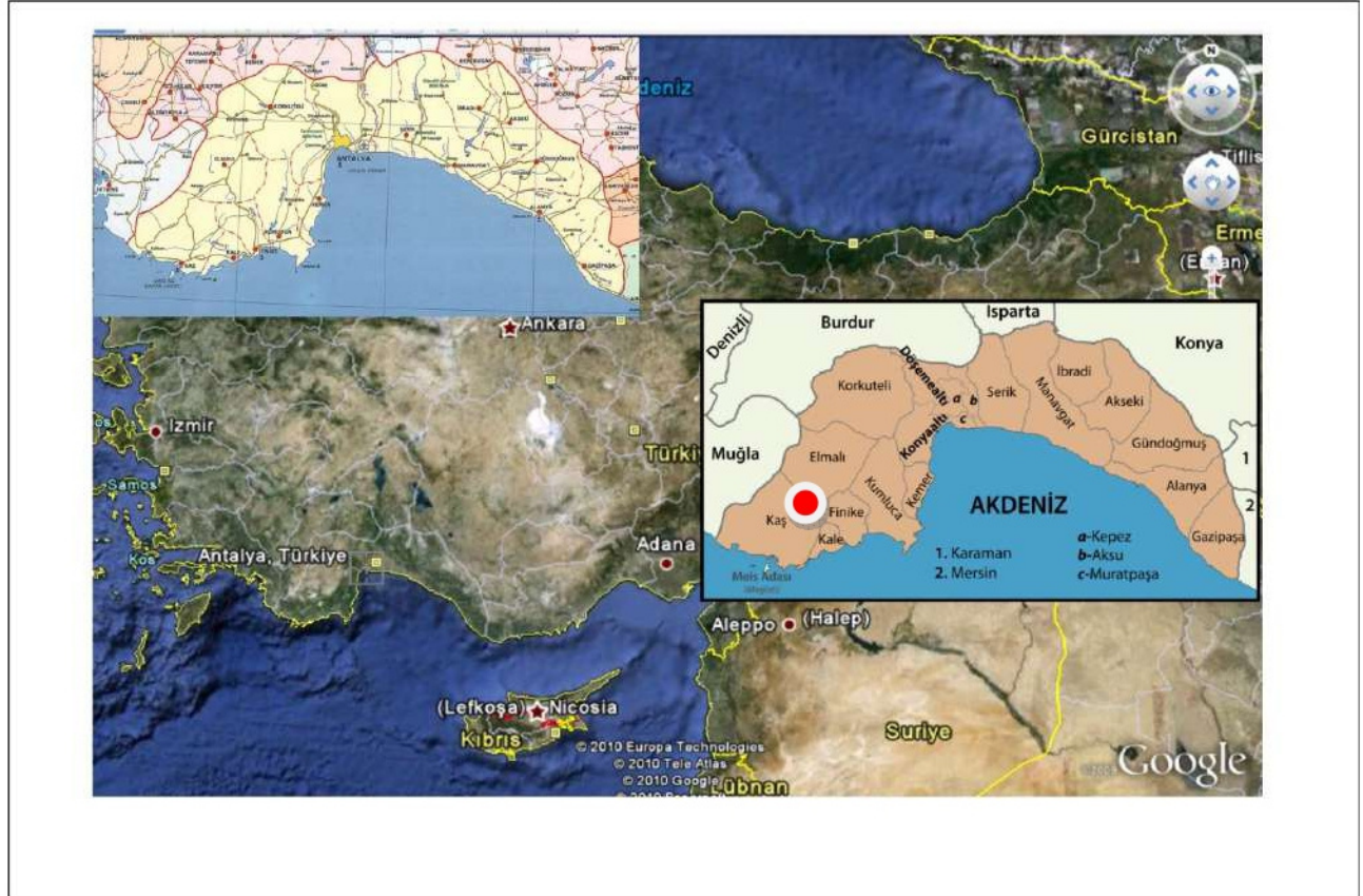
Harita 1 Planlama Alanın Ülke İçindeki Konumu

Planlama alanı yaklaşık 3,6 ha olup, 1/5000 Ölçekli ITRF-96 Elmalı O23-d-20-c, O23-d-20-d paftaları, 1/1000 ölçekli ITRF-96 Elmalı O23-d-20-d-3-c, O23-d-20-c-4-d paftaları içerisinde kalmaktadır.