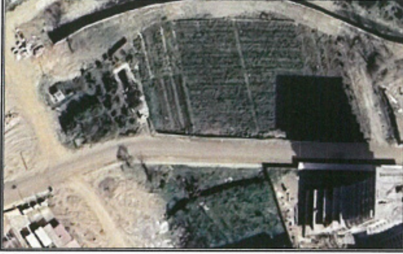
Şekil 1. Hava Fotoğrafi

Antalya İli, Alanya İlçesi, Mahmutlar mahallesi sınırları içerisinde; P28A03A1A paftalarında 1056 ada kuzeyinde bulunan park alanlarında trafo alanı planlanması amacı ile 1/1000 ölçekli Uygulama İmar Planı Değişikliği hazırlanmıştır.