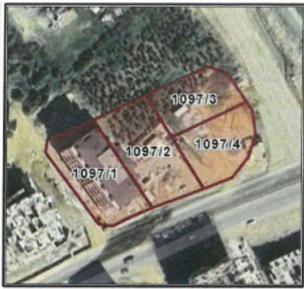
Şekil 2. Parselasyon Planı