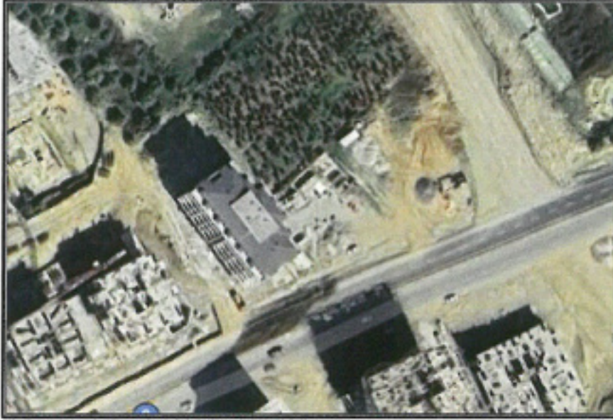
Şekil 1. Hava Fotoğrafı

Antalya İli, Alanya İlçesi, Mahmutlar mahallesi sınırları içerisinde; P28A03A1D paftasında, 1097 ada kuzeyinde bulunan park alanında trafo alanı planlanması amacı ile 1/1000 ölçekli Uygulama İmar Planı Değişikliği hazırlanmıştır.