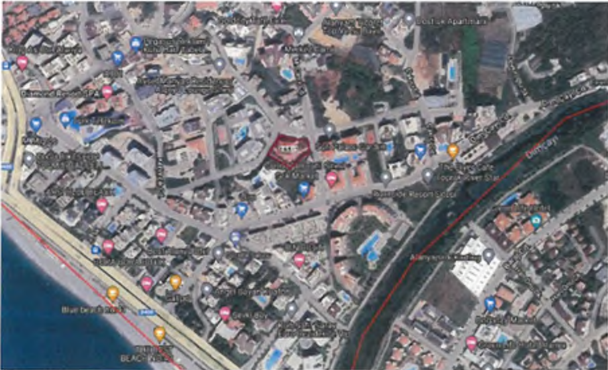
Şekil 1 - 165 Ada 1 Parselin Konumu

Tosmur Mahallesi, 165 ada, 1 no.lu parselimizde yer alan yapıya Mülga Tosmur Belediyesi tarafından verilmiş, 16.03.2005 tarih ve 2005/15 sayılı Yapı Ruhsatı, 10.01.2008 tarih ve 2008/21 sayılı Yapı Kullanma İzin Belgesi alınarak, tapuda kat irtifakı (36 adet bağımsız bölüm) kurulmuştur.