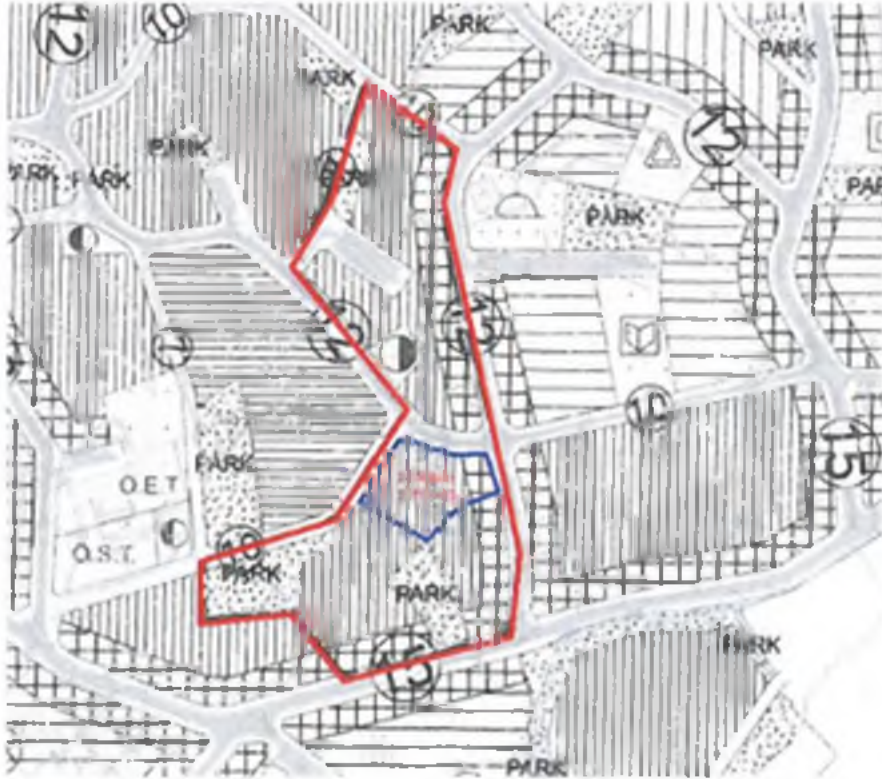
Şekil 3 - Mevcut 1/5000 ölçekli Nazım İmar Planı

Parselimizin bulunduğu yapı adasına mevcut 1/5000 ölçekli Nazım İmar Planı Hükümlerine göre "Yüksek Yoğunlukta Konut Alanı" ve "Ticaret - Konut Alanı" olarak yapılanma koşulları belirlenmiş olup, yukarıda da belirtildiği üzere parselimizde Yapı Ruhsatı ve Yapı Kullanma İzin Belgesi bulunan, kat irtifakı da kurulmuş (36 adet bağımsız bölüm) yapı bulunmaktadır.