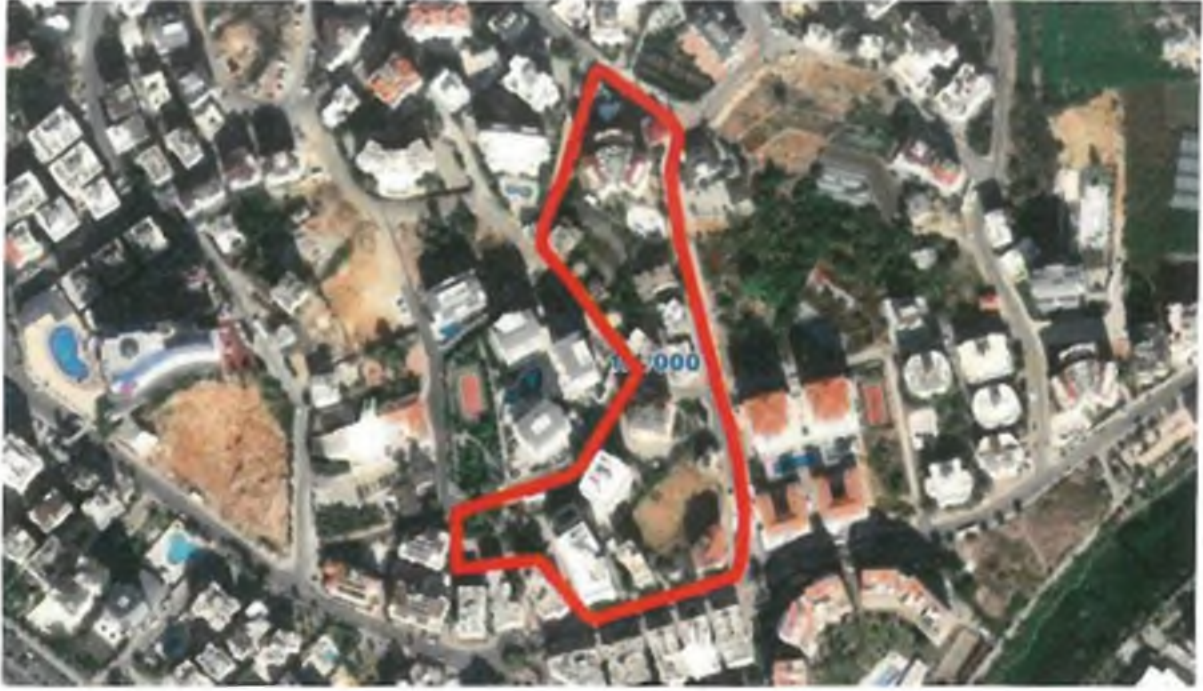
Şekil 2 - 1/5000 ölçekli Nazım İmar Planı Revizyonu yapılan alan

Parselimizin bulunduğu yapı adasına mevcut 1/5000 ölçekli Nazım İmar Planı Hükümlerine göre "Yüksek Yoğunlukta Konut Alanı" ve "Ticaret - Konut Alanı" olarak yapılanma koşulları belirlenmiş olup, yukarıda da belirtildiği üzere parselimizde Yapı Ruhsatı ve Yapı Kullanma İzin Belgesi bulunan, kat irtifakı da kurulmuş (36 adet bağımsız bölüm) yapı bulunmaktadır.