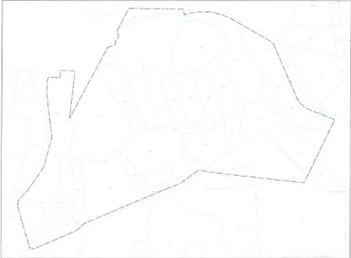
Şekil 3. Kadastral Durum

Plan değişikliğine konu alan, Alanya ilçesi Okurcalar Mahallesi sınırları içerisinde kalmaktadır. Plan değişikliğine konu alan 146, 147 ve 148 numaralı adaların bir kısmını kapsamaktadır. Plan değişikliğine konu alan yaklaşık olarak 16,3 hektardır. Parsellerin bulunduğu alanda henüz imar uygulaması yapılmamıştır.