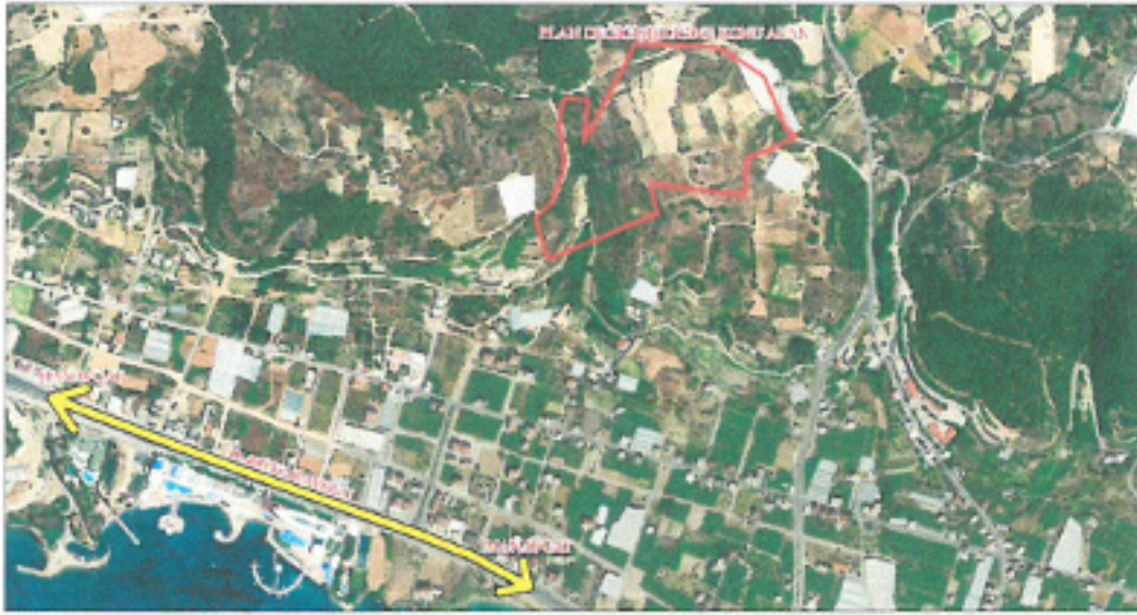
Şekil 1. Uzak Hava Fotoğrafi

Planlama alanı Antalya İli, Alanya İlçesi, Okurcalar Mahallesi sınırları içerisinde O27-D-09-C ve O27-D-10-D nolu 1/5000 ölçekli nazım imar planı paftalarında yer almaktadır. Plan değişikliğine konu alan; Okurcalar Mahallesi 146, 147, 148 numaralı adaların, bir kısmını kapsamaktadır. Planlama alanı Okurcalar Mahallesi D-400 karayolunun yaklaşık 1 km kuzeyinde, Okurcalar Mahallesi Berat Hayriye Cömertoğlu Çok Programlı Lise' sinin yaklaşık olarak 450 metre kuzeybatısında kalmaktadır. Plan değişikliğine konu alan yaklaşık 16.3 hektar büyüklüğündedir.