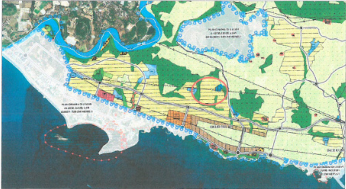
Şekil 5. 1/25000 Ölçekli onaylı Nazım İmar Planı