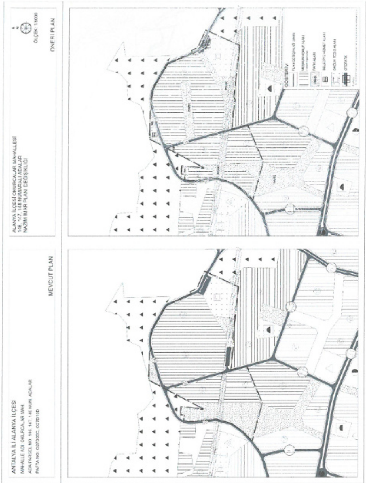
Şekil 6. Mevcut 1/5000 Ölçekli Nazım İmar Planı- Teklif 1/5000 Ölçekli Nazım İmar Planı