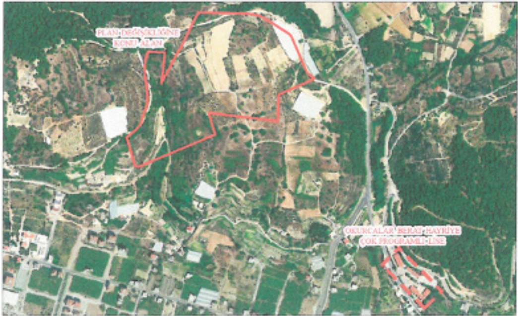
Şekil 2. Yakın Hava Fotoğrafi