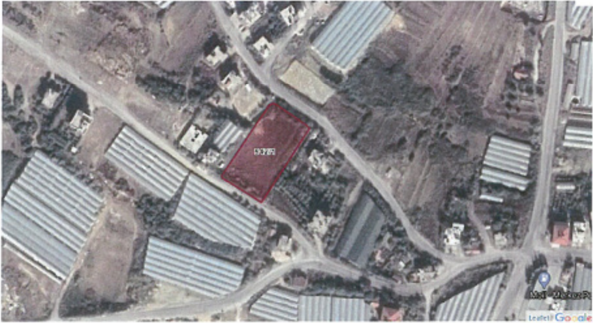
Şekil.1- 542 ada 1 parsel mevcut görünüm

Milli Emlak Müdürlüğü tarafından söz konusu parsel için verilen ön izin belgesinde ise imar planı kararlarına uygun olarak konut ve enerji hariç olmak üzere eğitim, ticari, sağlık, turizm, sanayi, tarım ve hayvancılık, sosyal, kültürel tesisler yapılmak üzere izin verildiği belirtilmektedir. Bu nedenle kiralanan parselin yürürlükteki imar planında konut alanı olarak belirlenmiş olması ve bunun dışındaki bir fonksiyonda ruhsatlandırılması mümkün olmadığından fonksiyon değişikliği için plan tadilatı yapılmasına ihtiyaç duyulmuştur.