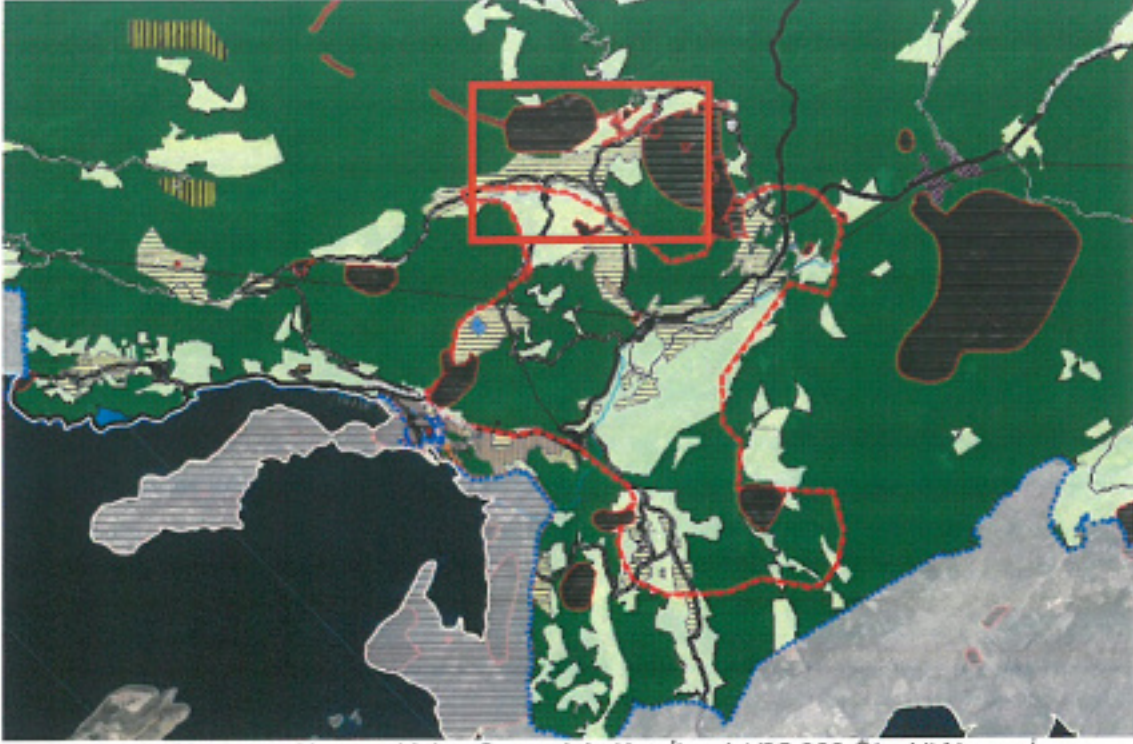
Harita 2: Planlama Alanı ve Yakın Çevresinin Kaş İlçesi 1/25.000 Ölçekli Nazım İmar Planındaki Yeri

Planlama Alanı; Antalya Büyükşehir Belediyesi Meclisi'nin 14/11/2022 tarih ve 971 sayılı kararı ile onaylanan Kaş İlçesi 1/25000 Ölçekli Nazım İmar Planı'nda; Gelişme Konut Alanı, Orman Alanı ve Tarım Alanları olarak Harita 15'te gösterilmiştir.