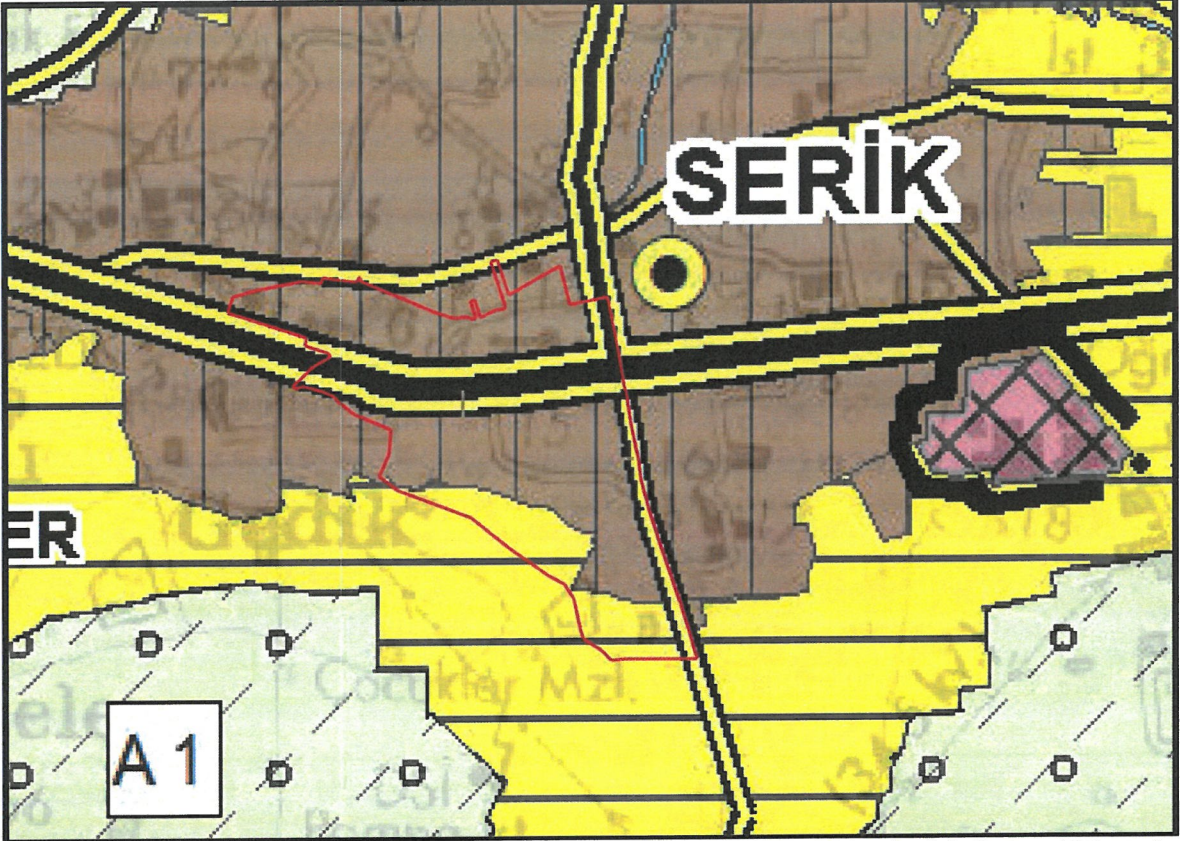
Şekil 1: Antalya-Burdur-Isparta Planlama Bölgesi 1/100.000 ölçekli Çevre Düzeni Planındaki Yeri

Antalya Büyükşehir Belediyesi Meclisince onaylanan Antalya İli Serik İlçesi 1/100.000 ölçekli Çevre Düzeni Planı O26 pafta sınırları içerisinde kalmakta olup; planda bu mahallenin büyük bir bölümü kentsel yerleşim alanı, güney kısmında az bir bölümü ise kentsel gelişme alanı olarak gösterilmiştir. " Antalya-Burdur-Isparta Planlama Bölgesi 1/100.000 ölçekli Çevre Düzeni Planındaki Yeri " Şekil 1' de gösterilmiştir.