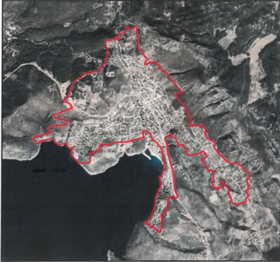
Planlama Alanı Uydu Görüntüsü

Antalya İli Kaş İlçesi Kalkan, Bezirgan, İslamlar Mahalleleri 1/1000 Ölçekli Uygulama İmar Planı Revizyonuna Askıda Yapılan İtirazların Değerlendirilmesine Esas Hazırlanan 1/1000 Ölçekli Uygulama İmar Planı Değişikliği; 16.05.2022 tarih ve 408 sayılı karar ile Antalya Büyükşehir Belediye Meclisi tarafından onaylanarak, 02.06.2022 tarihinde 30 gün süreyle askıya çıkarılmıştır. Söz konusu İmar planına askı süresi içerisinde yapılan itirazlar, 09.01.2023 tarih ve 11 sayılı kararı ile Antalya Büyükşehir Belediye Meclisince değerlendirilmiş olup kabul edilen itirazlar plan değişikliği şeklinde hazırlanmıştır.