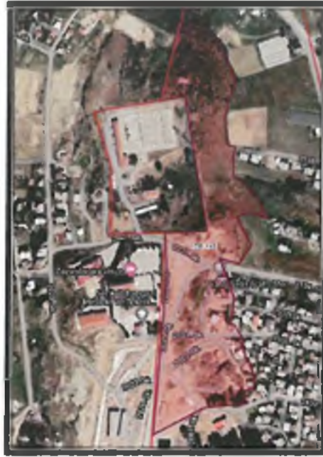
Şekil 2. Parselasyon Planı